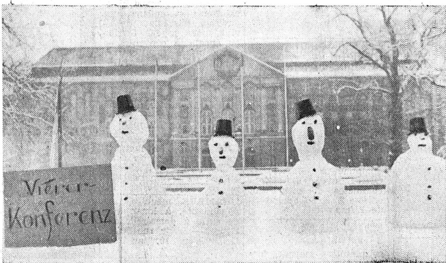
Quand les Berlinoises font de l'humour...

contre les conducteurs d'automobiles imprudents: l'article 315 prévoit des pénalités pour « blessures à soi-même » et envoie en prison un hôte ayant trop bien reçu ses invités.