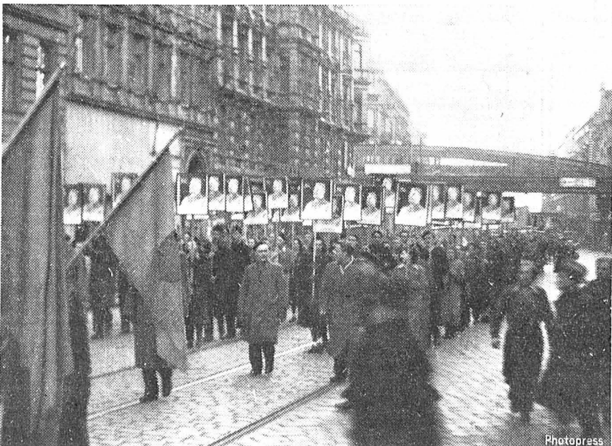
Afin d'éviter toute insuffisance de mise en scène, les «manifestations populaires spontanées» des démocraties populaires sont préparées avec grand soin, surtout les défilés de parades. Les répétitions pour la rencontre de la jeunesse communiste du monde entier, prévue pour le mois d'août à Berlin-Est, ont déjà débuté. — Notre photo montre la «Jeunesse allemande libre» du secteur russe de Berlin s'exerçant à défiler avec des portraits de Staline.