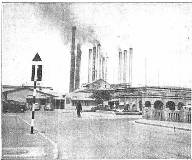
L'un des plus grands ports pétroliers du monde: Abadan.