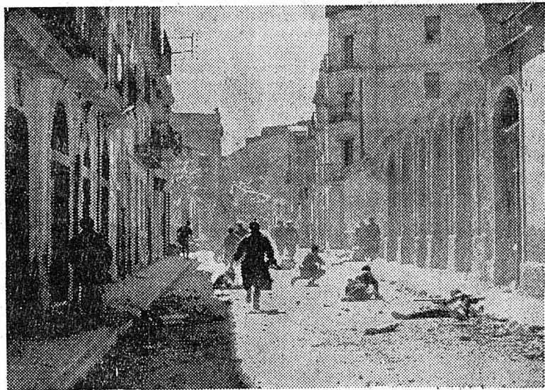
Rencontrant des îlots de résistance, les nationalistes avancent prudemment dans les rues de Llerida.

En trois minutes, les hommes sont habillés et armés. Un matin, branle-bas général. Ils partent