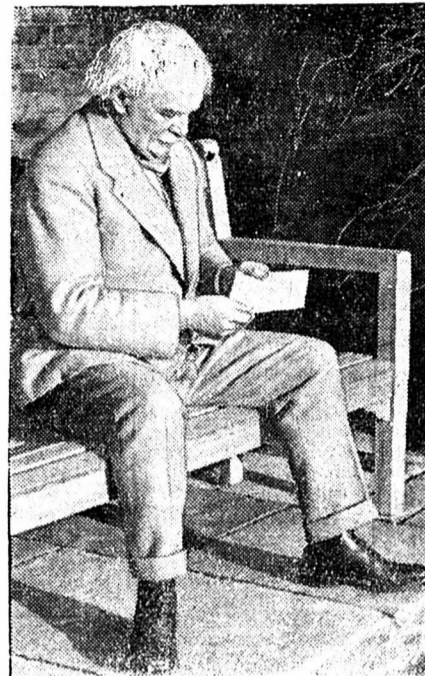
M. Lloyd George

est allé chercher une seconde jeunesse à Ceylan, patrie du thé. Comme on peut s'en rendre compte d'après notre cliché, l'homme d'Etat anglais semble bien l'avoir trouvée. La photo ci-dessus a été prise le jour où M. Lloyd George fêtait son 69 me anniversaire et au moment où il lisait un des nombreux télégrammes qu'il a reçus à cette occasion.