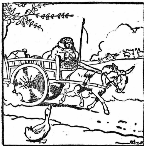
Un automobiliste qui a eu des revers