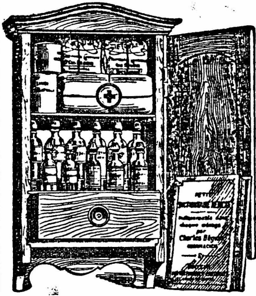
Dimensions : 50x30x14 cm

Ce problème, après un examen minutieux, a été résolu par la GRANDE PHARMACIE CENTRALE qui offre aujourd'hui au public