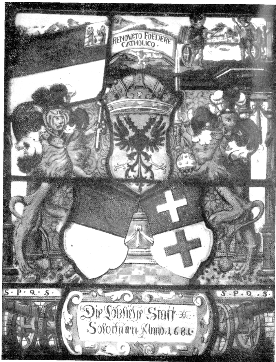
Vitrail aux armes de Conches et Soleure rappelant le renouvellement de l'alliance entre les VII Cantons et les VII Dizains