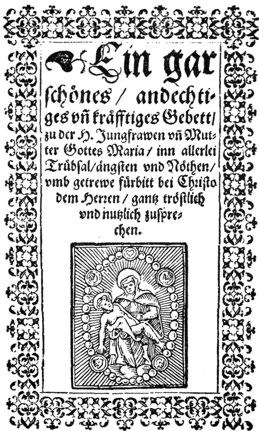
Page du « Catholisches Handbüchlein » imprimé par Guillaume Mäss, Fribourg, 1598