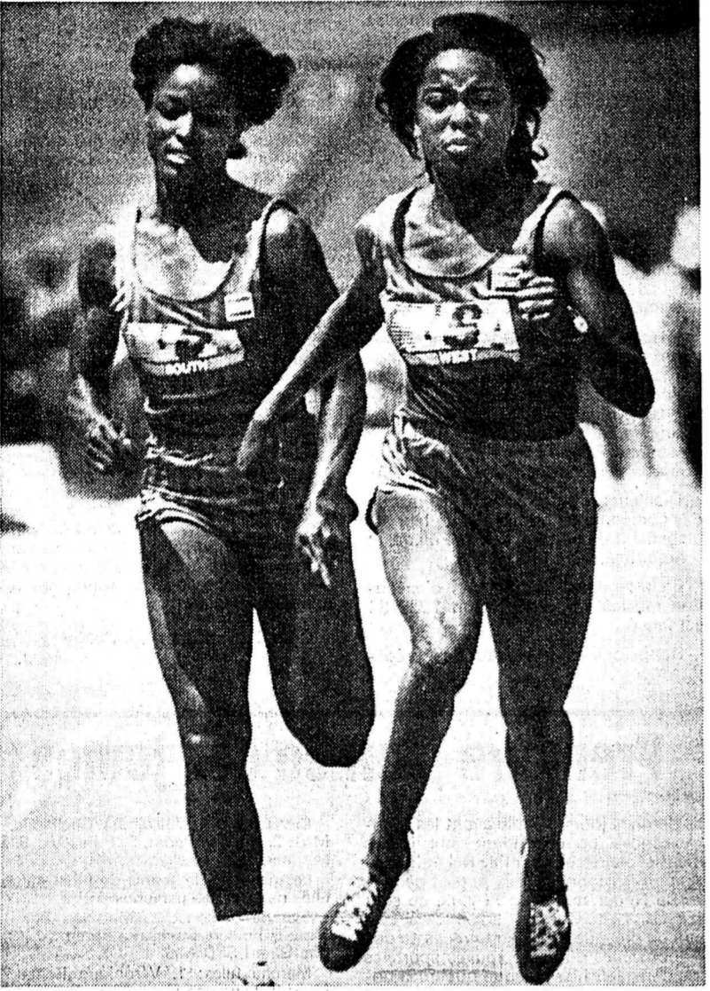
Puissance fabuleuse pendant l'exploit.