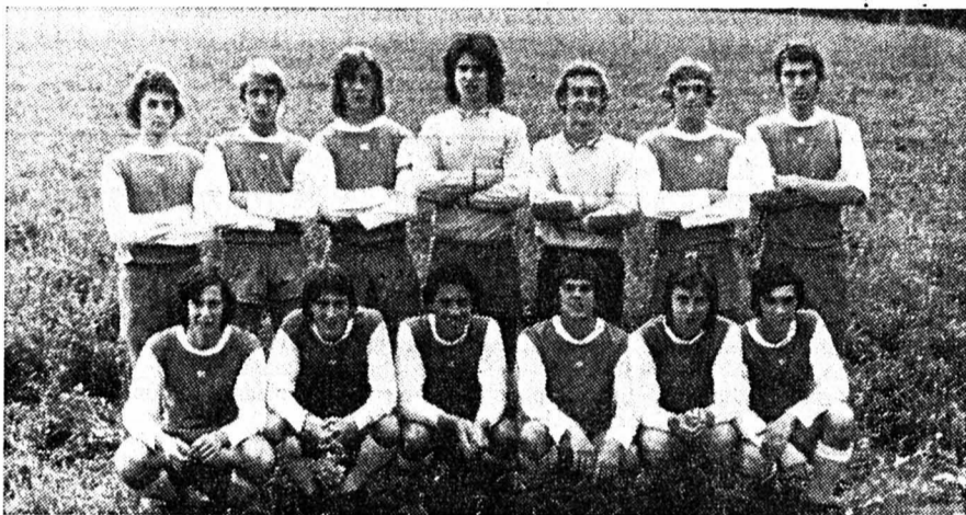
Deuxième : PSB Besançon.