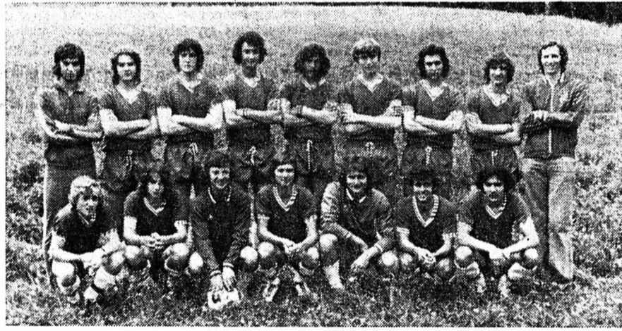
Septième : F.-C. Comète Peseux.