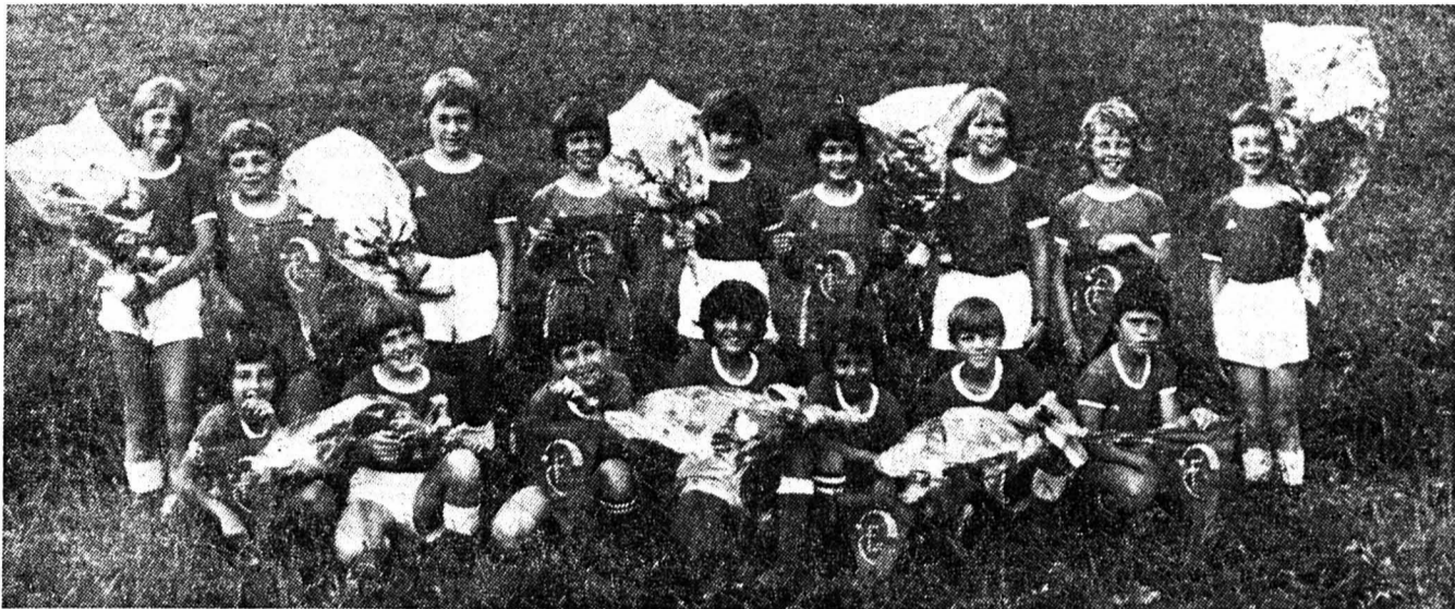
Les « Poussins » de Comète avant la présentation des équipes.

Finale 1 re et 2 me places : Besançon-Bacigalupo 1-1 après prolongations (Bacigalupo vainqueur au tir des pénalités par 4-3).