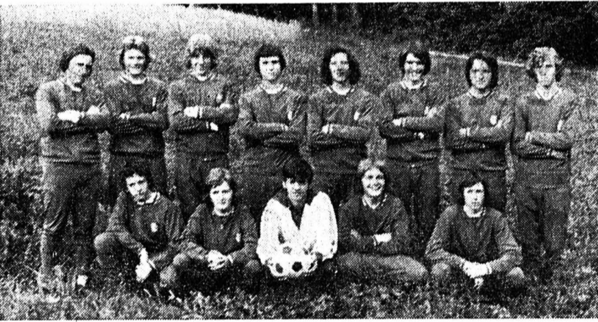
Sixième : F.-C. La Chaux-de-Fonds.