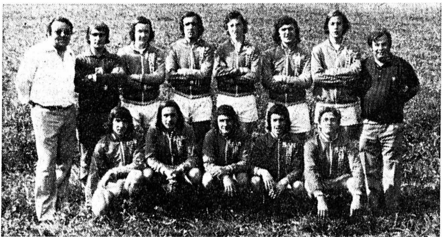
Troisième : San Gabriel Barcelone.