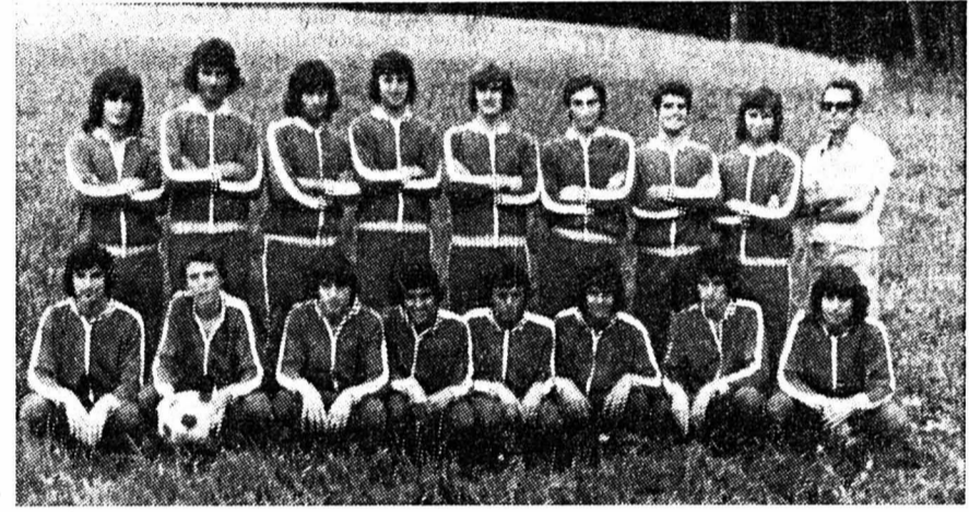
Cinquième : Hibernians Malte.