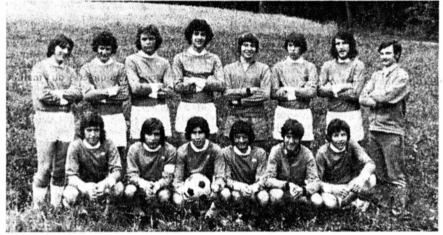
Huitième : ASSM Montpellier, gagnant du Fair-play.

Confection-mercerie « Au Griffon » Grand-Rue 32