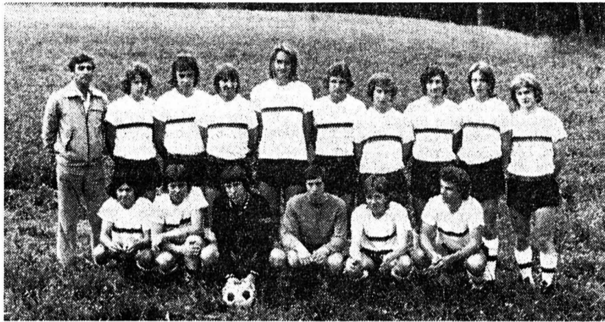
Quatrième : Neuchâtel Xamax.