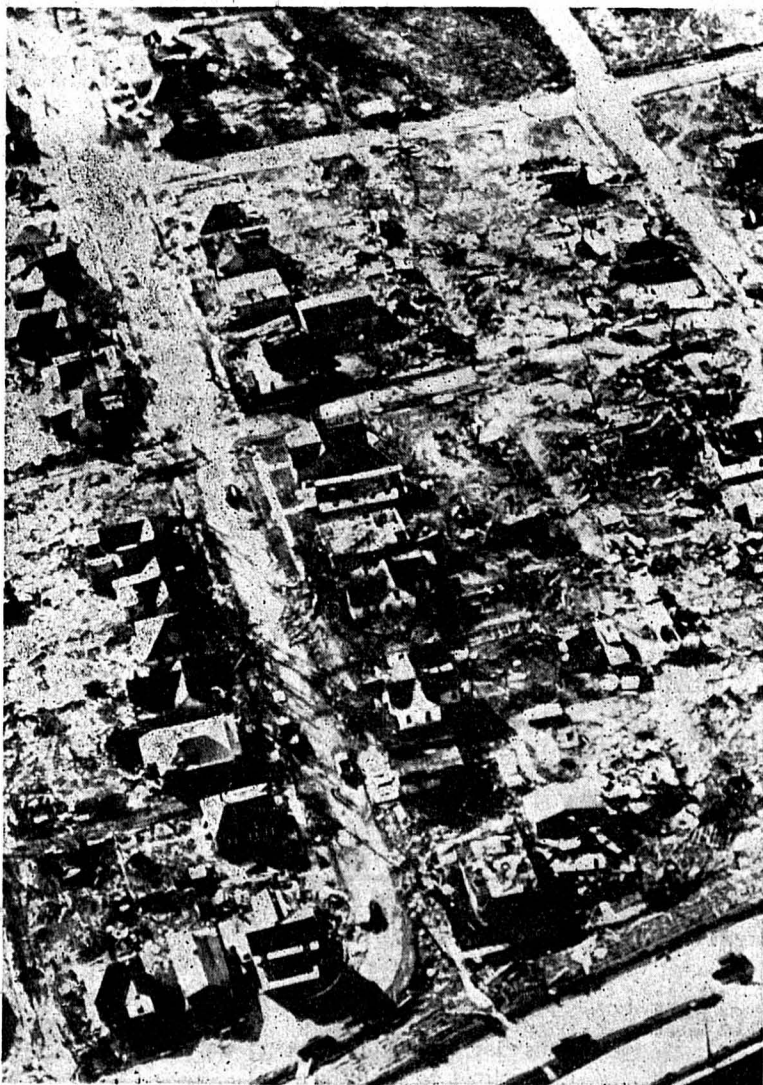
La petite ville de Murphy, dans l'Etat de l'Illinois, aux Etats-Unis, vient d'être cruellement dévastée par une tornade au cours de laquelle plusieurs personnes ont trouvé la mort.