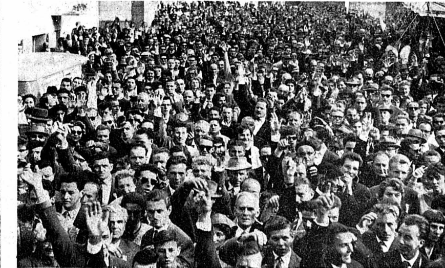
Ce sont 42,000 personnes qui sont venues à Delémont soutenir le mouvement jurassien. Sur notre photo, les participants votent à main levée la résolution que nous avons publiée hier.