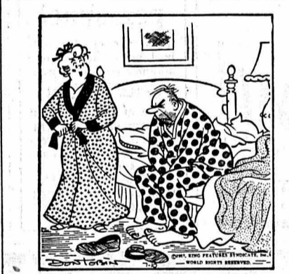
— A voir ton visage, personne n'osera t'affronter aujourd'hui !