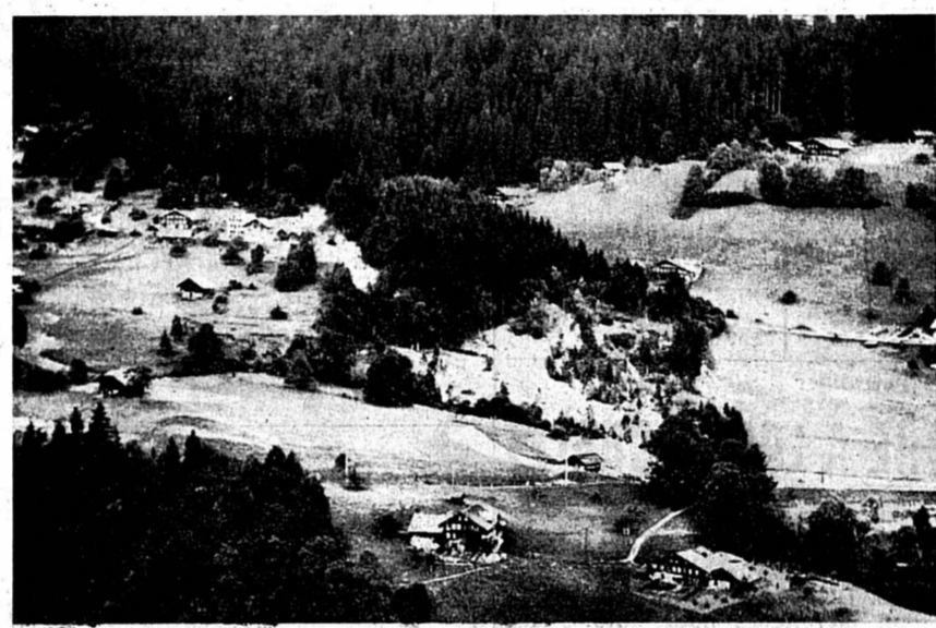
La région d'Oberwil, dans le Simmental, est menacée par un important glissement de terrain. Environ 200.000 mètres cubes de terrain sont en mouvement.