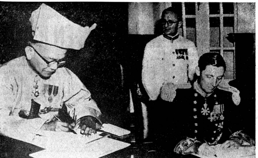
Abdul Rahman, nouveau prince constitutionnel de Malaisie, signe, aux côtés du haut-commissaire britannique, sir Donald MacGillivray, le traité consacrant l'indépendance de la Malaisie.