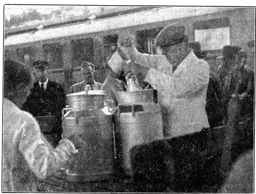
Les commissaires assistent aux opérations de prélèvement.

Les membres de la commission du Grand Conseil chargée d'examiner le projet de réorganisation de l'économie laitière du canton, avaient été convoqués hier matin à 6 h. 15 à la gare