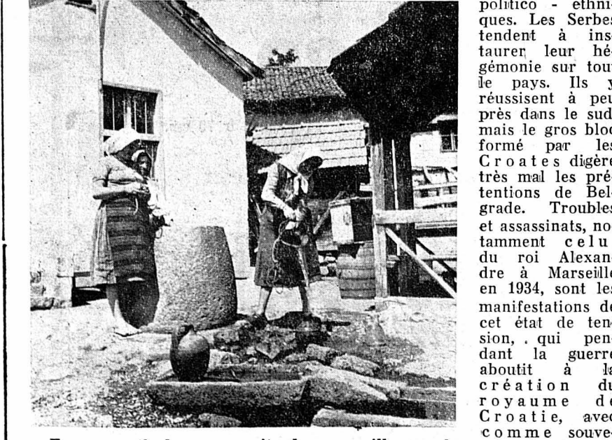
Femmes orthodoxes au puits dans un village serbe.