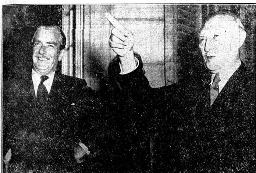
Sur la terrasse du palais Schaumburg, le chancelier Adenauer disait à M. Eden: «Le mauvais temps est parti, le soleil brille de nouveau... quand un photographe surprit les deux hommes. Rarement cliché fut si joliment symbolique!

Signé le 17 mars 1948 par la Grande-Bretagne, la France et le Benelux, le traité de Bruxelles était dirigé contre l'Allemagne. Aujourd'hui, une résurrection de ce traité se ferait avec l'Allemagne occidentale et avec l'Italie, l'autre vaincu d'alors, qui n'y avait pas adhéré. Si M. Eden suggère aux Européens de reprendre le traité de Bruxelles, c'est évidemment pour doter l'Europe d'une organisation défensive qui ne soit pas une nouvelle improvisation.