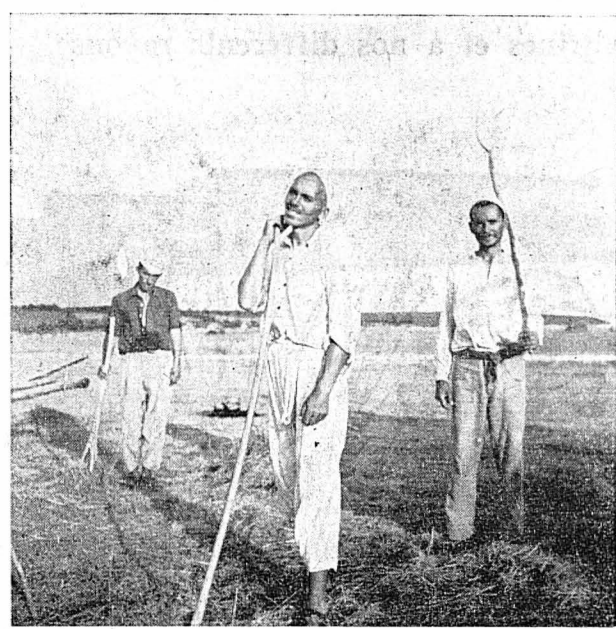
Groupe d'Arnautes, paysans musulmans de la minorité albanaise.