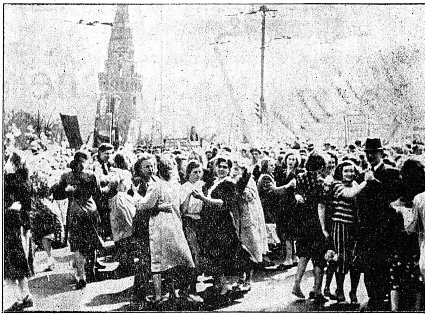
On danse sur la place Rouge à Moscou.