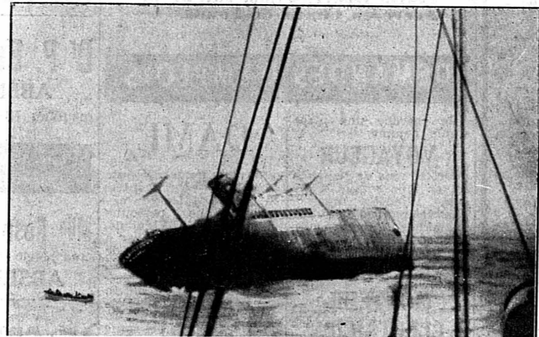
Une photographie du « Flying Enterprise » prise quelques heures avant son naufrage.