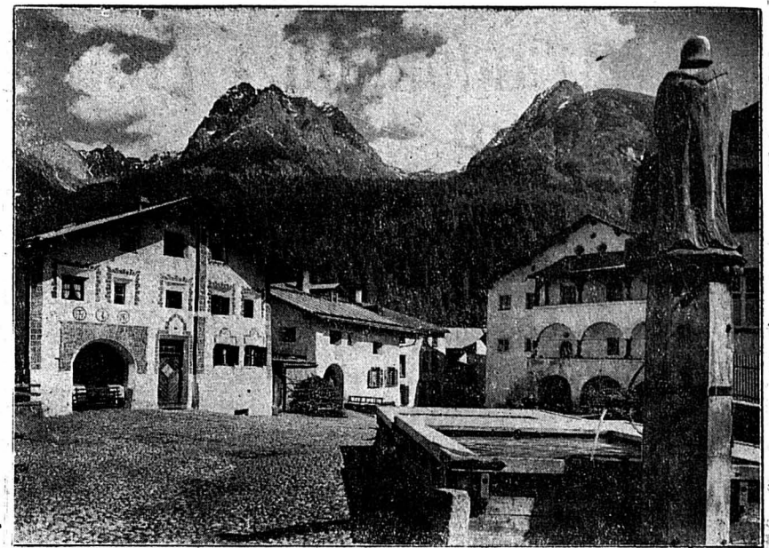
La place du village, à Scuol. Au fond, le Piz Lischana (à gauche) et le Piz San Jon.