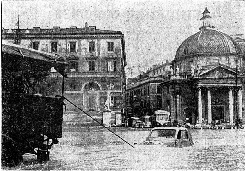
Une vue saisissante des inondations, provoquées par la pluie diluviennne de la semaine dernière à Rome. Piazza del Popolo, l'eau atteignit un mètre par endroits.

La tension s'accroît entre Belgrade et Rome au sujet de Trieste