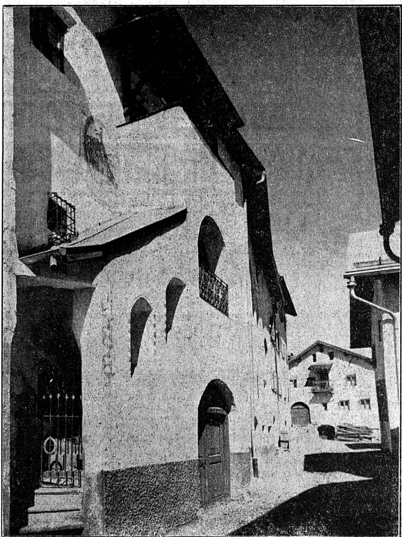
Une rue de Scuol Sura (Schuls-Dessus).