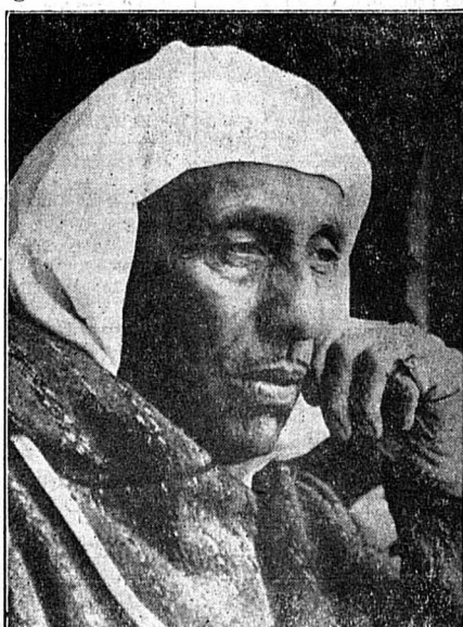
El Glaoui, pacha de Marrakech.