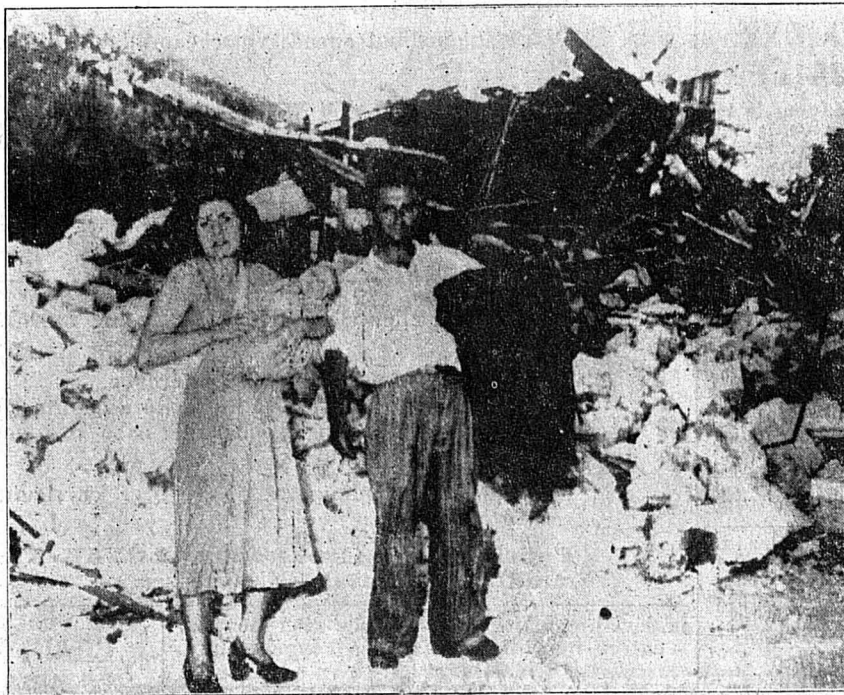
Une famille de Céphalonie devant les ruines de sa maison.