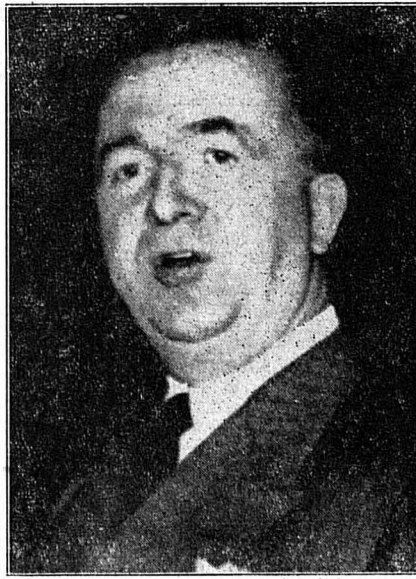
M. Pella, chargé de constituer le cabinet italien, présentera sa réponse aujourd'hui à M. Einaudi, président de la République.

Le quorum de 209 voix étant presque atteint