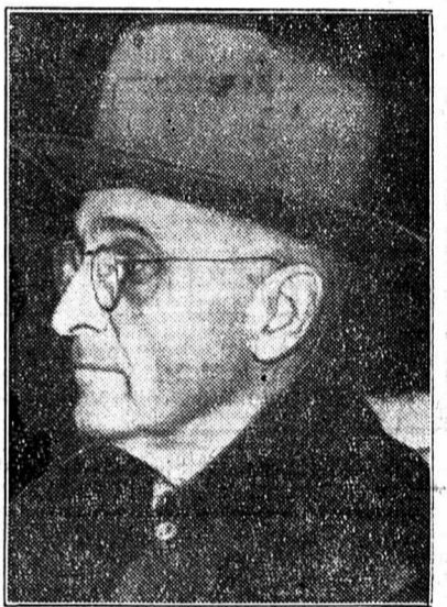
Le président Truman

M. Winston Churchill, chef de l'opposition, remercia le premier ministre