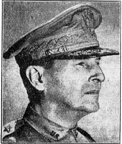
Le général Mac Arthur

WASHINGTON, 27 (Reuter). — Le président Truman a donné l'ordre à l'aviation et à la flotte des Etats-Unis d'entrer en action en Corée. La 7 ème escadre a reçu l'ordre d'empêcher toute attaque contre Formose.