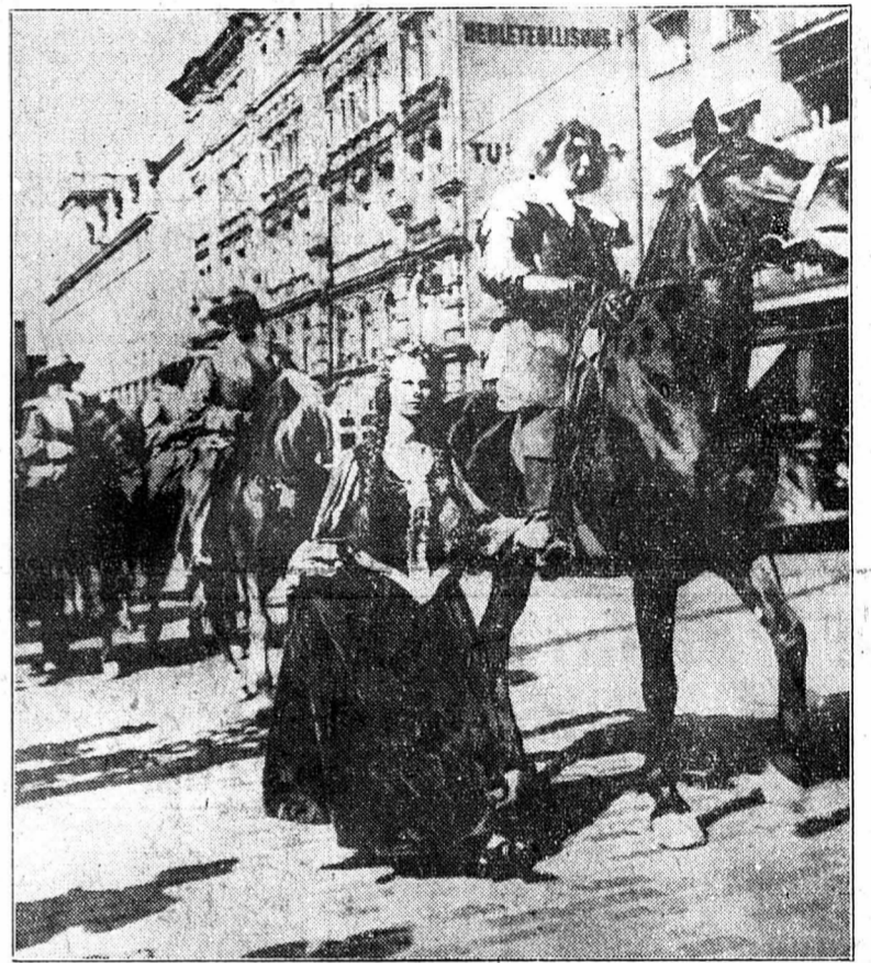
Fondée en 1550 par le roi Gustave de Suède, Helsinki vient de célébrer son 400 me anniversaire. Voici, dans le cortège commémoratif, une reconstitution historique de la première armée finlandaise.