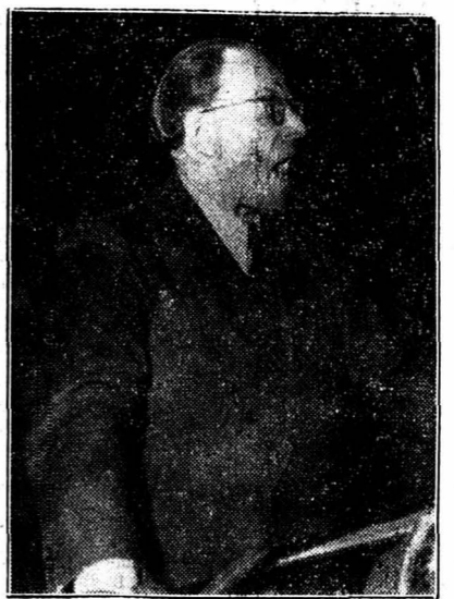
M. OTTO GROTEWOHL qui constituera le gouvernement d'Allemagne orientale.