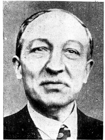
M. YVON DELBOS un des « papables » présentés par le président de la République.

couloirs, il semble que M. Vincent Auriol soit en mesure de désigner aujourd'hui samedi, la « personnalité pressentie » pour former le prochain gouvernement. Un socialiste sera vraisemblablement appelé à « essuyer les plâtres ».