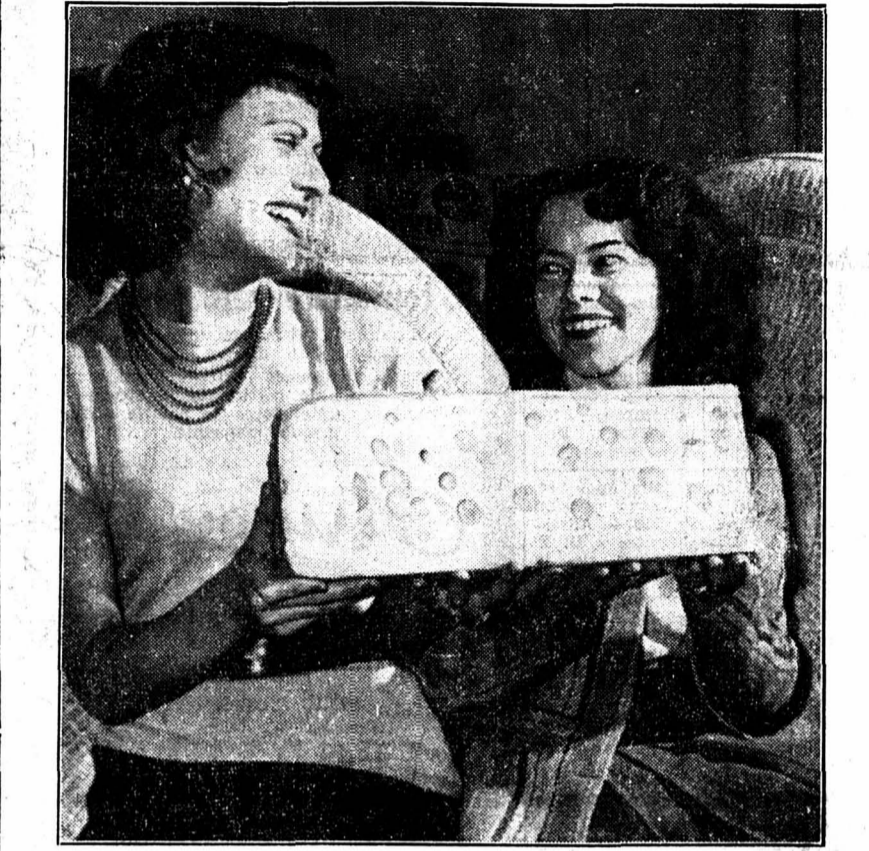
Pour la première fois depuis la guerre, du fromage suisse est arrivé aux États-Unis. Ces deux jeunes Américaines ont-elles envie de faire une fondue ?