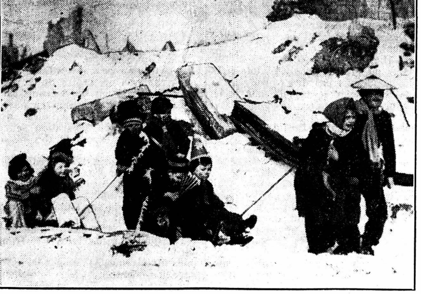
Le Carnaval a toujours été fêté dans les grandes villes allemandes. A Cologne les enfants ont repris cette tradition. En voici un groupe dans les ruines de la cité recouvertes de neige.