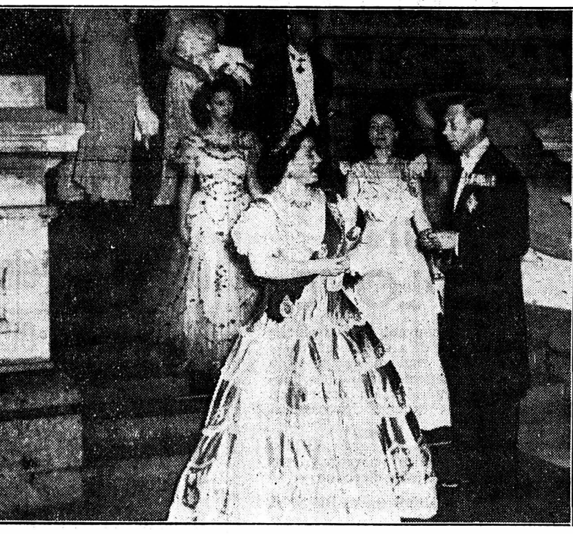
Le roi George VI et la reine d'Angleterre sont arrivés hier à Port-Elizabeth. Ils ont été acclamés par plusieurs milliers d'anciens combattants et par 23,000 écoliers. On reconnaît sur cette photographie prise dans le grand escalier de la maison du parlement, au Cap, le roi George, la reine et les deux princesses.