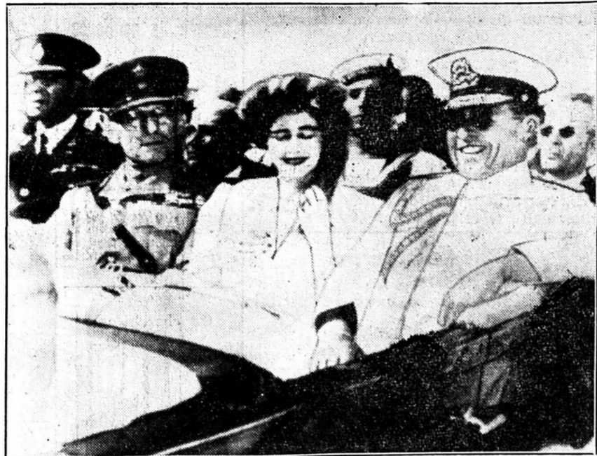
Cent et un coups de canons ont salué l'arrivée à Athènes du roi Georges de Grèce que l'on reconnaît ici, à gauche, en compagnie de la princesse Frédérique et du prince Paul.