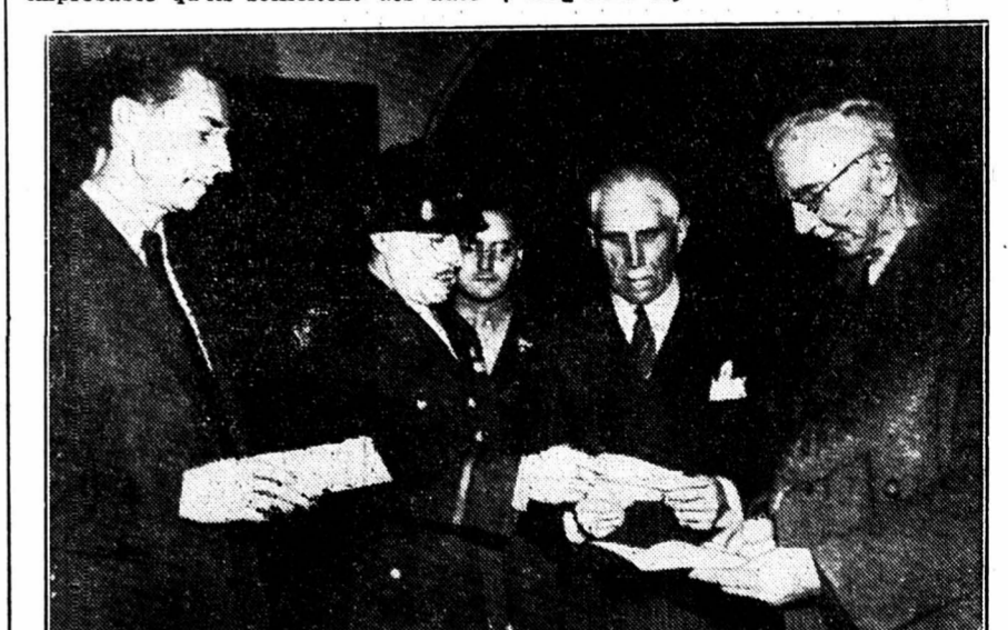
Les trois acquittés, Fritsche, à gauche, von Papen, au centre, et Schacht, à droite, reçoivent leurs passeports des mains d'un officier américain. Où vont-ils ? Personne ne le sait encore...