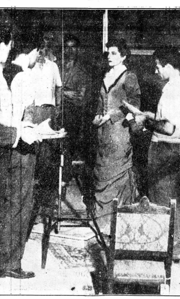
Miss Sarah Churchill, fille de l'ex-premier ministre britannique, tourne actuellement un film à Rome. La voici pendant une répétition.

C'est un film de toute grande classe que nous propose l'Apollo cette semaine, un film qui émeut, étreint, bouleverse et qui laissera à chacun une impression profonde et un sentiment de perfection achevée. « Hantise » est l'histoire d'un infortuné et impassible gentleman qui assassina jadis une torse anglaise aussi célèbre que ses bijoux. Il a été assez habile pour échapper