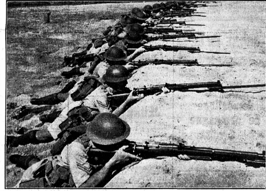
Sur les côtes du nord de l'Australie, des soldats du bataillon « Darwin » s'exercent à tirer au fusil.

Après la violente diatribe de M. Antonesco contre la Hongrie