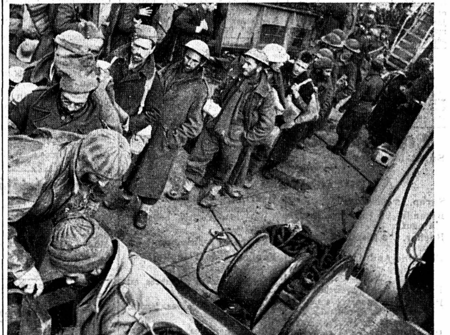
Embarquement d'un contingent de prisonniers britanniques dans un port d'Afrique septentrionale.