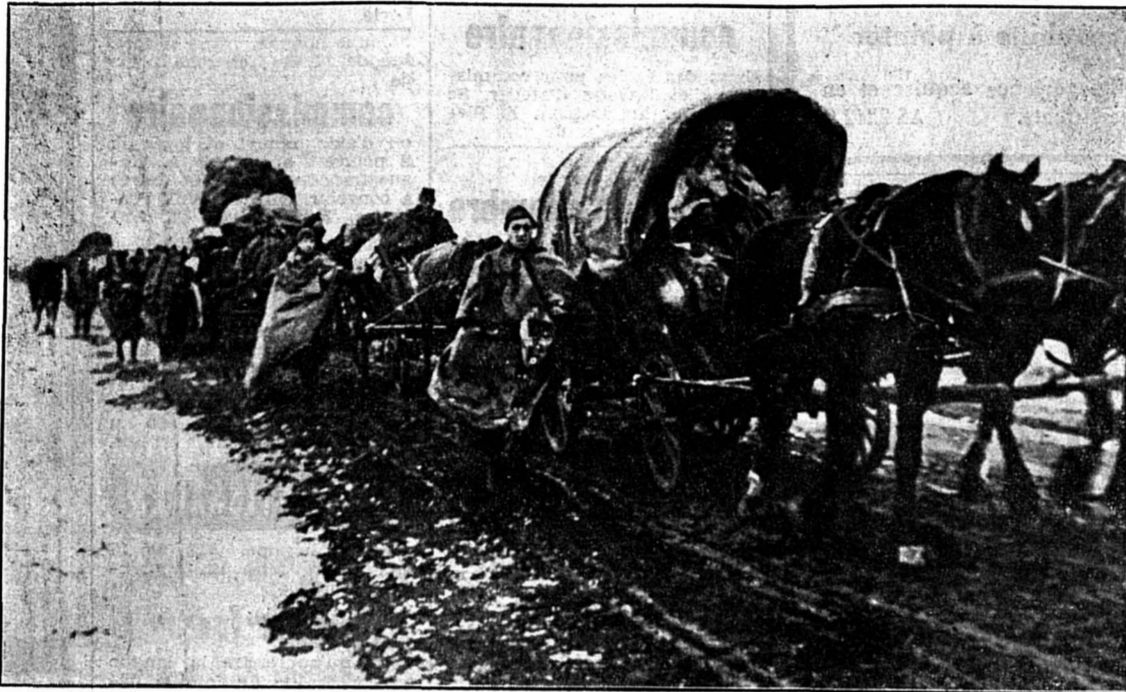
Enveloppés dans leur manteau, des soldats allemands sont en marche sur une route de Russie dont les bords sont recouverts de neige.

Lire en dernières dépêches notre téléphone de Berlin sur l'évolution de la guerre en Russie.