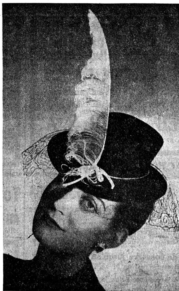
Chapeau de taupé noir avec plume d'autruche et petite voilette noire