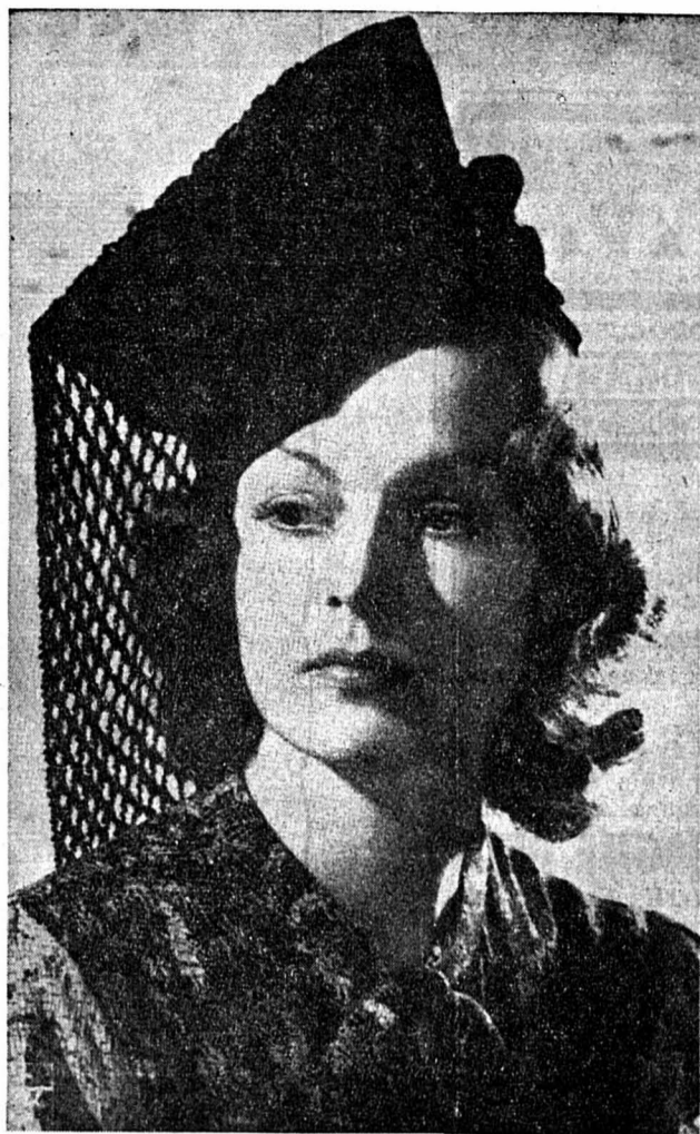
Feutre mousseline noir rayé de velours. Une résille de velours noir est posée en mantille

Voici la recette d'un bon gâteau-biscuit économique, dit « Louise-Charlotte »: Dans un récipient, mélanger à sec une tasse à café de maïs (dit polenta), une tasse à café de farine, si possible blanche, une demi-tasse de sucre fin et une cuillère à café de levure sans goût. Dans un autre récipient, battre un œuf entier, avec une même tasse de lait cuit tiède, une prise de sel, l'écorce d'un gros citron ainsi que le jus, 50 gr. de beurre ou de graisse au beurre. Mélanger en une fois ces deux préparations, bien remuer le tout, cuire à toute petite flamme 45 à 50 minutes et sans jamais ouvrir le four avant 30 minutes. Ceci est très important pour tous les biscuits qui doivent lever.