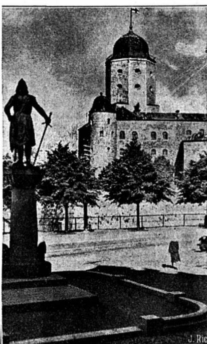
Le château de Viborg ville qui vient d'être reprise par les Finlandais.

sions font admettre qu'un important dépôt de munitions a été détruit. Au cours d'une attaque aérienne sur un embranchement de la ligne de Mourmansk, trois locomotives ont été détruites. En outre, les avions finlandais ont atteint des colonnes ennemies. Sur la partie sud de l'isthme de Carélie, deux avions ennemis ont été détruits.