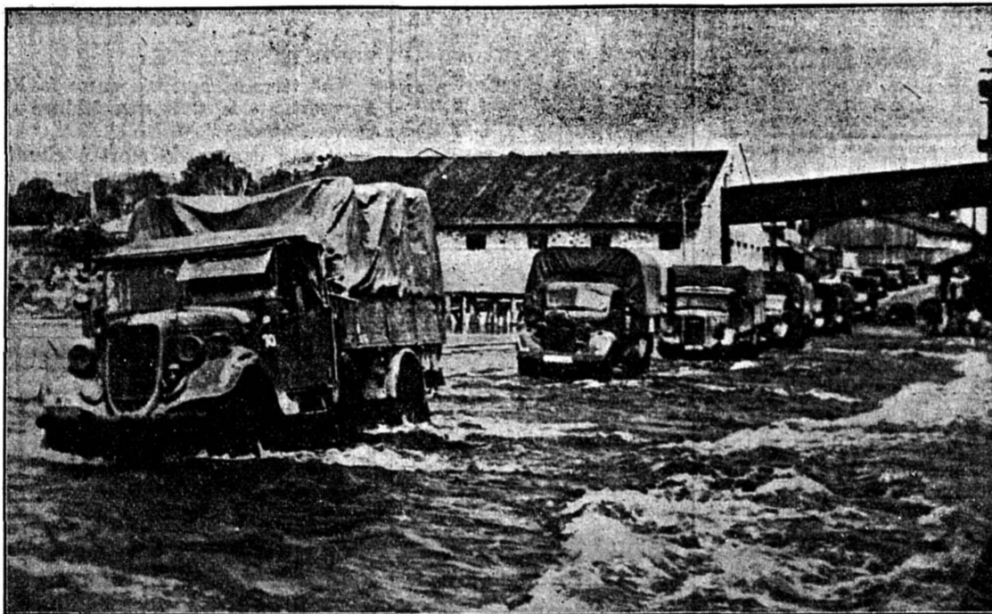
Quelque part sur le front, les Russes ont fait sauter un barrage et les eaux se sont répandues dans toute la campagne avoisinante. Aussi les colonnes motorisées allemandes doivent-elles continuer leur progression sur des routes submergées.

BERLIN, 2. — Le D. N. B. communique: Les unités de l'aviation allemande opérant avec l'armée, à savoir la D.C.A. et les aviateurs de reconnaissance, ont détruit à elles seules