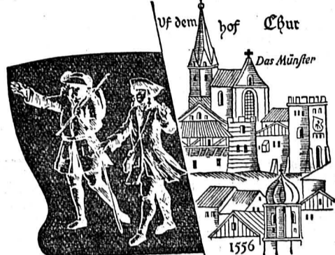
Les 650 ans de la Confédération