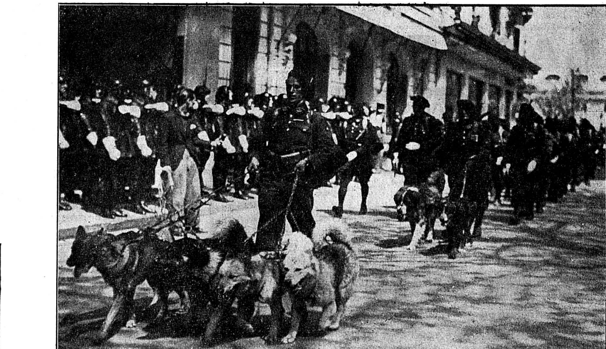
A Vichy, le 6 me bataillon de chasseurs alpins défile devant l'hôtel du Parc, siège du gouvernement, avec ses chiens de liaison.