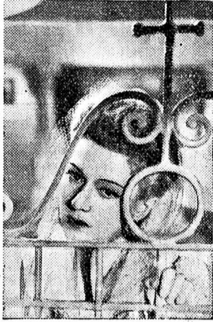
Edwige Feuillère incarne la belle comtesse SOPHIE CHOTAK, épouse morganatique de François-Ferdinand

« Les auteurs et les interprètes ont réalisé une œuvre en tous points remarquable, émouvante, poignante et vraie, de cette vérité qui ne s'arrête pas au détail des choses, ni à la surface des sentiments, mais qui reflète l'esprit d'une époque et pénètre jusqu'au cœur et à l'âme des personnages. »