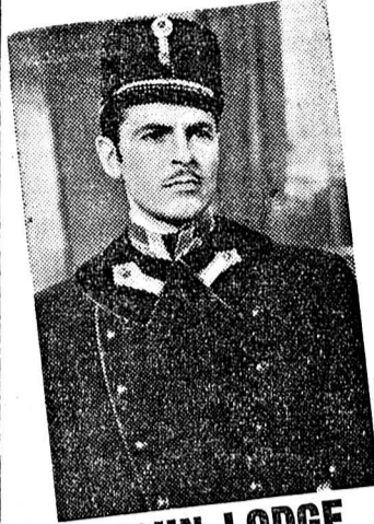
JOHN LODGE en archiduc François-Ferdinand d'Autriche

L'histoire d'un grand amour qui naquit dans l'intrigue, vécut dans l'ombre et se termina par une tragédie qui changea la face du monde