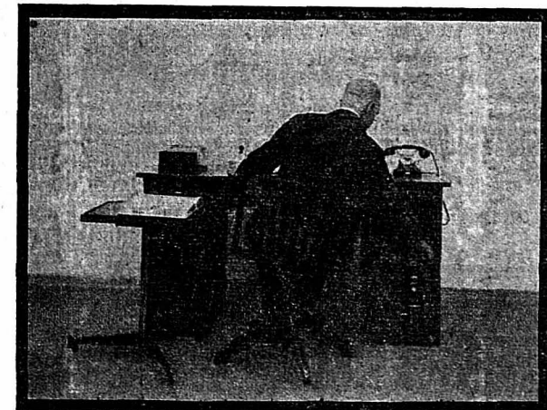
Inclinaison de côté