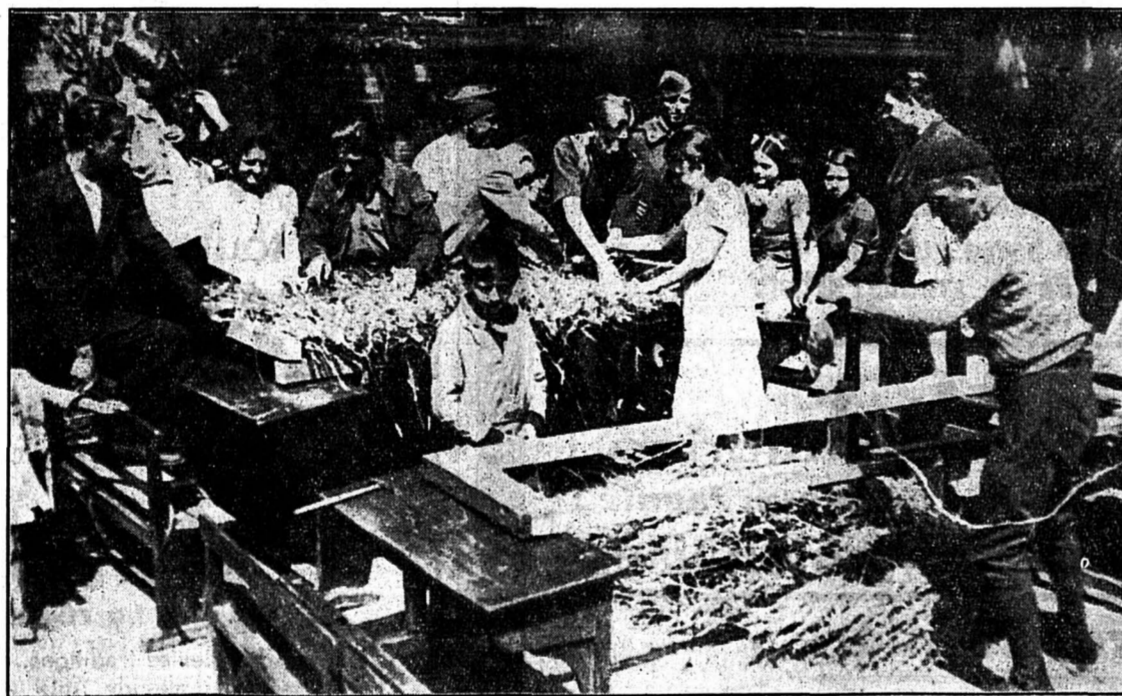
En France, en attendant leur retour dans leur foyer, les évacués de la région de Clermont-Ferrand confectionnent des paillasses pour l'aménagement des centres d'accueil.