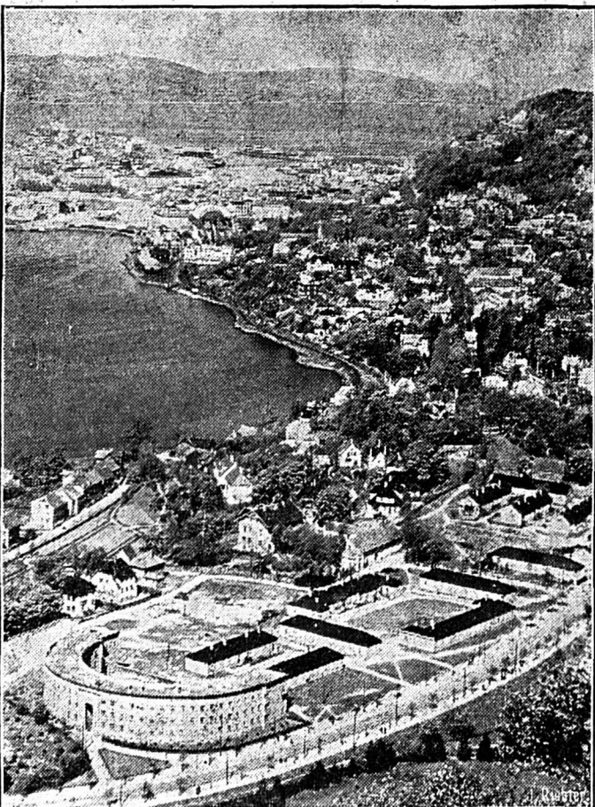
Une vue de Bergen, ville de la Norvège occidentale, qui a été occupée par les Allemands

Lire la suite des nouvelles en quatrième page.