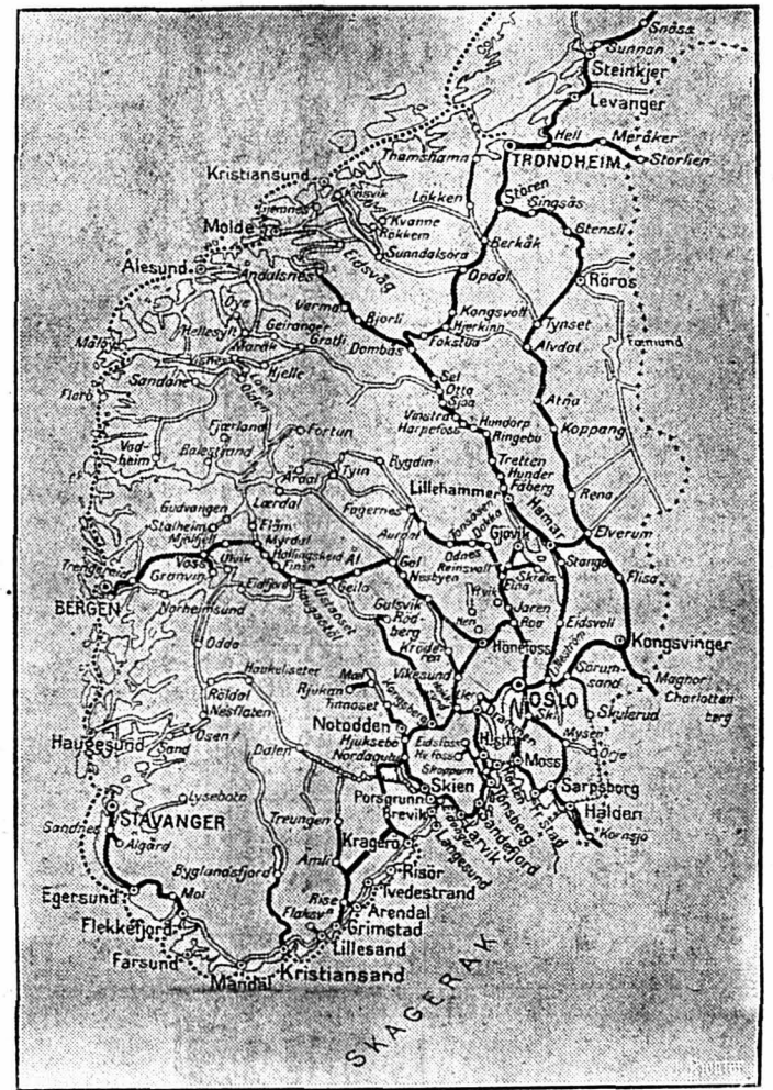
Une carte de la partie méridionale de la Norvège

D'importants combats navals entre la flotte occidentale et la flotte allemande seraient en cours dans la Mer du Nord