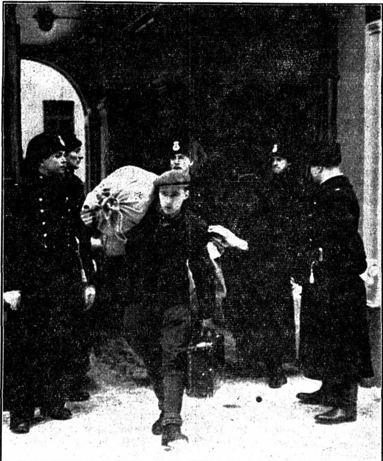
Une série de perquisitions vient d'avoir lieu le même jour dans toute la Suède, dans les milieux communistes. Les documents saisis dans les bureaux du journal communiste de Stockholm «Ny Dag», dont les locaux sont gardés par la police, sont emmenés par les enquêteurs.