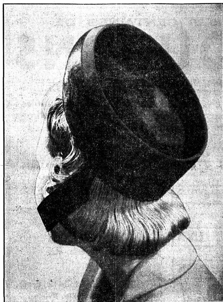
Relevé panne noire bordé et garni gros grain

L'on constate l'agréable mélange du crin brillant et du feutre mat, la grâce des nœuds de ruban, l'allure jeune des couteaux de plume et de feutre. L'on verra aussi des turbans dont le drapé sera plein de fantaisie et dont les teintes offriront d'agréables et parfois d'inattendus contrastes; c'est une coiffure originale que pourront porter avec crânerie et assurance les jeunes femmes et les un peu moins jeunes aussi, à condition d'y assortir, pour ces dernières, un maquillage savant et discret.