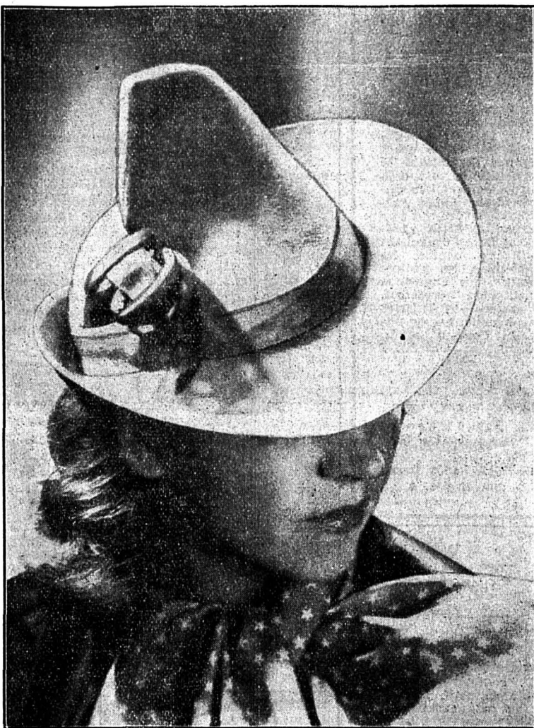
Feutre beige garni gros grain