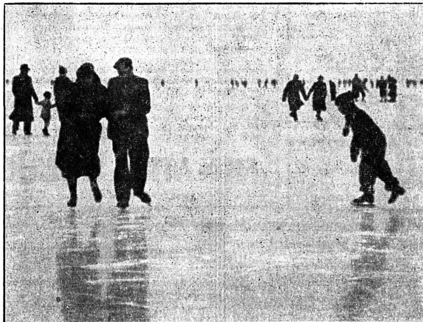
La glace est magnifique, aussi de nombreux patineurs se livrent-ils à leur sport favori.