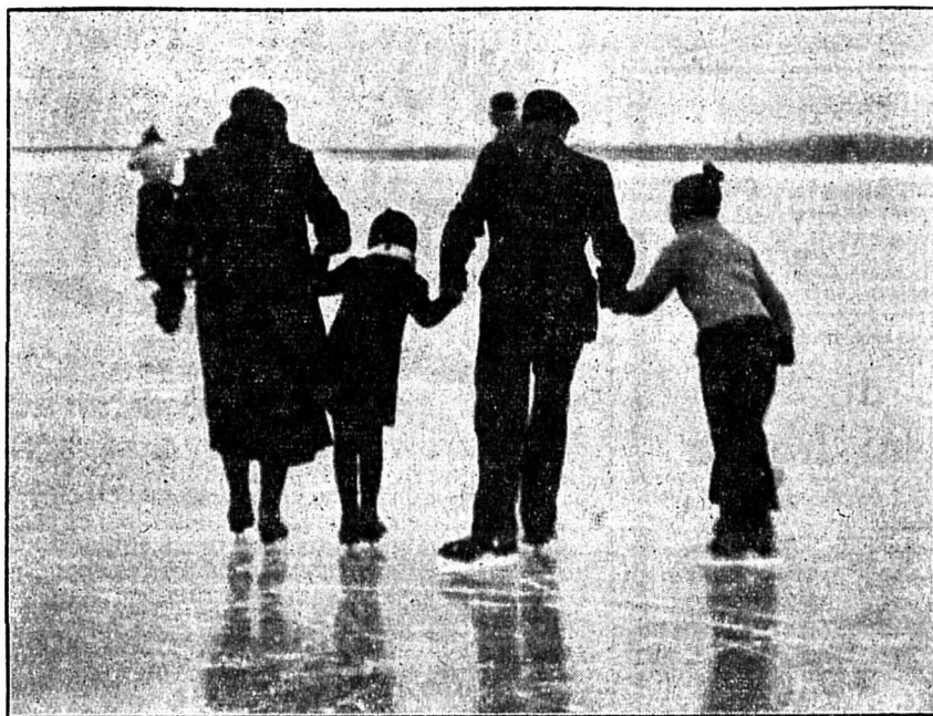
Une famille de patineurs.