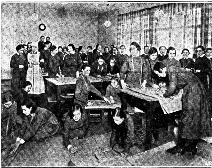
Les femmes et les jeunes filles finlandaises travaillent sans répit pour leur pays. Voici un cours de coupe de l'organisation des «Lottas».