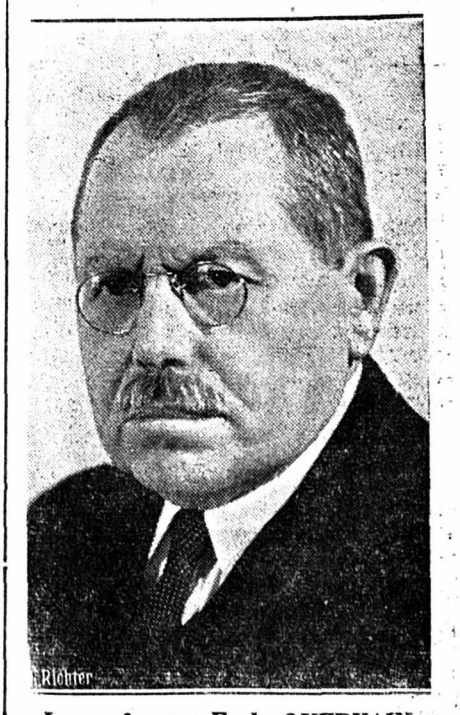
Le professeur F. de QUERVAIN

La réputation de chirurgien s'étendait au-delà des frontières suisses, a publié de nombreux ouvrages scientifiques. Il avait pris sa retraite de professeur en 1938.