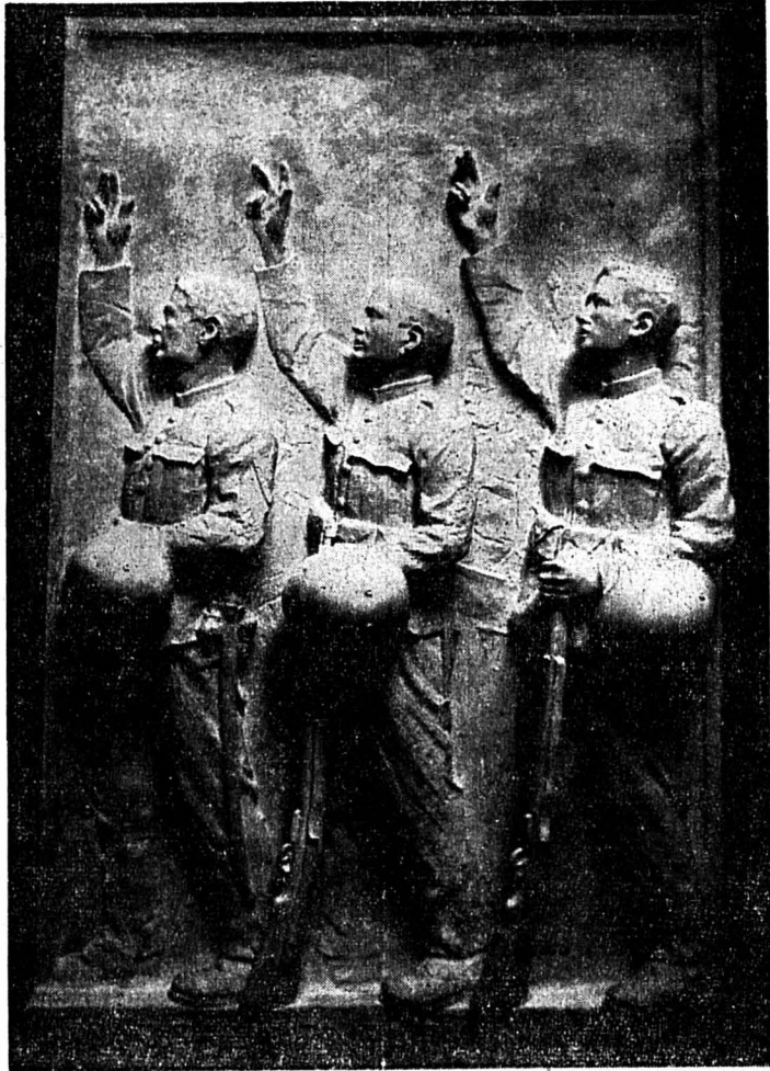
Une œuvre intéressante de l'exposition ouverte samedi : « L'assermentation » de l'appointé R. Raimondi, de Couvet

Quatre cent cinquante soldats ont envoyé leurs œuvres dont quelques-unes sont fort belles. Des murmures flatteurs se sont d'ailleurs fait entendre dans les diverses salles qui les abritent. (8.)