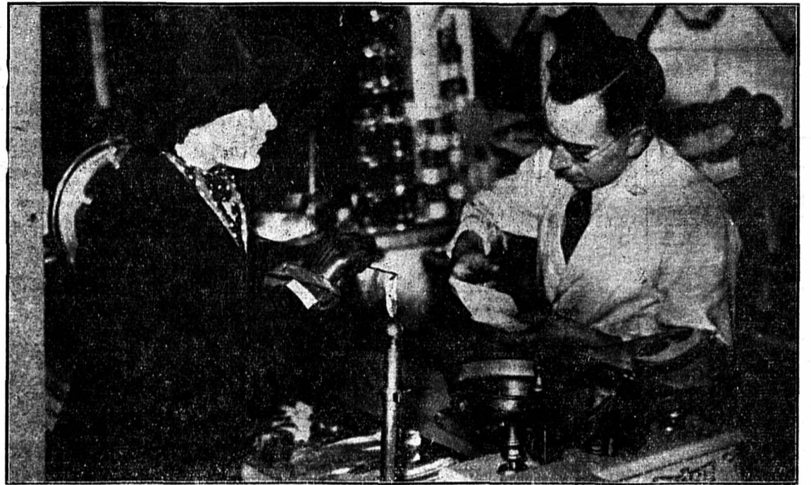
Le beurre, le sucre, le lard et le jambon sont maintenant rationnés en Grande-Bretagne. — Voici une jeune femme présentant dans une épicerie sa carte de rationnement