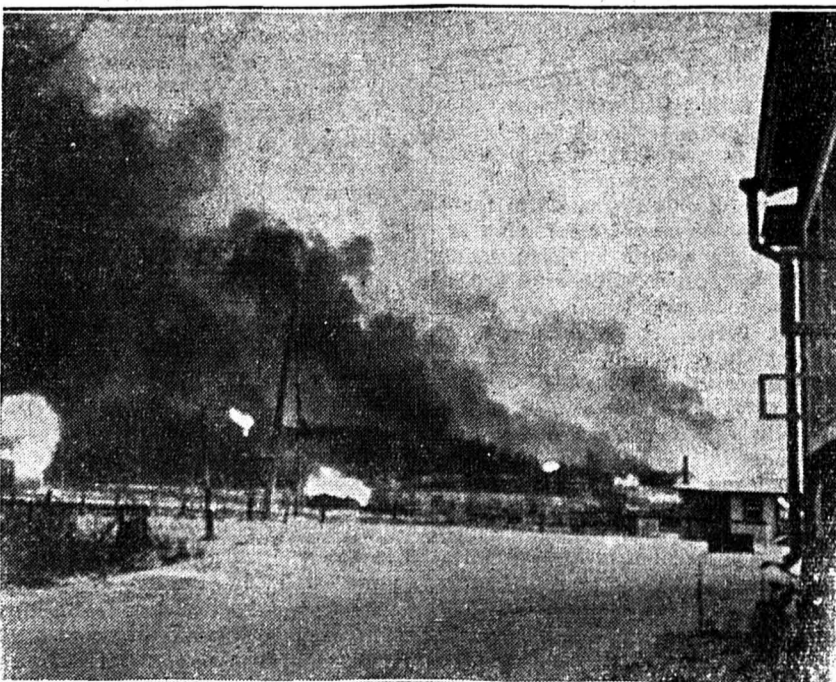
Un groupe de maisons incendiées par les Finlandais au cours d'une retraite stratégique sur le front de Suomosalmi

Cinq cents bombes ont été lancées par les avions soviétiques.