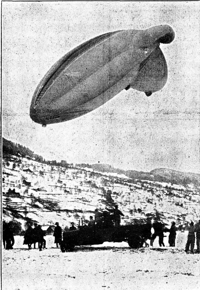
Sur le nouvel aérodrome de Buochs au bord du lac des Quatre-Cantons, la section de l'aviation et de la défense anti-aérienne de l'armée suisse a fait des essais de barrages de ballons. L'Angleterre s'en sert ainsi contre les attaques d'avions, mais c'est la première fois en Suisse que ce type de ballons est essayé. - Voici un premier ballon pendant les manœuvres d'atterrissage à Buochs.