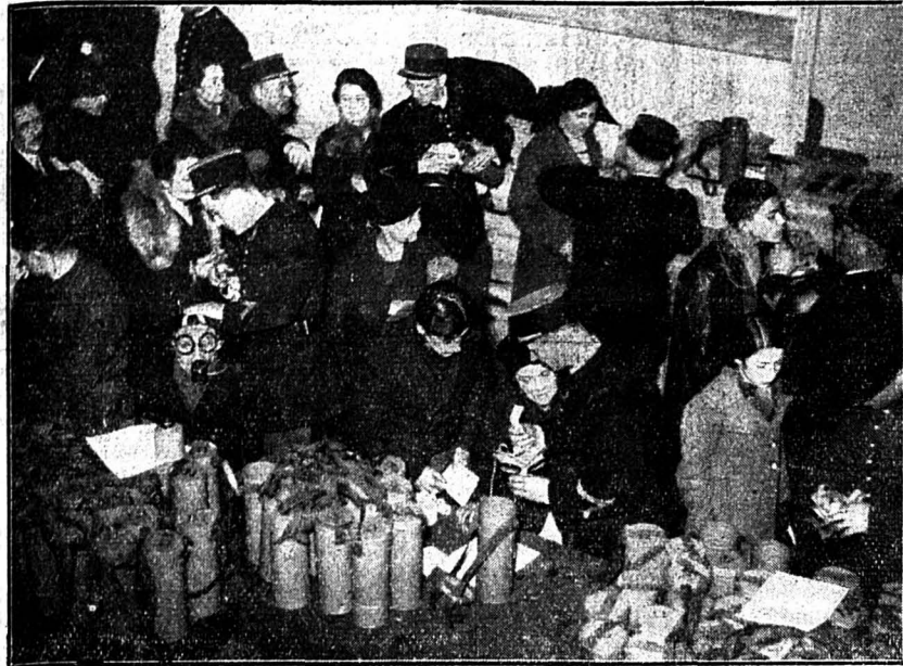
La distribution des masques à gaz destinés à la population parisienne a commencé il y a quelque temps dans différents quartiers de la capitale. Des gardes mobiles essayent les masques aux femmes et aux enfants en leur donnant les instructions nécessaires.