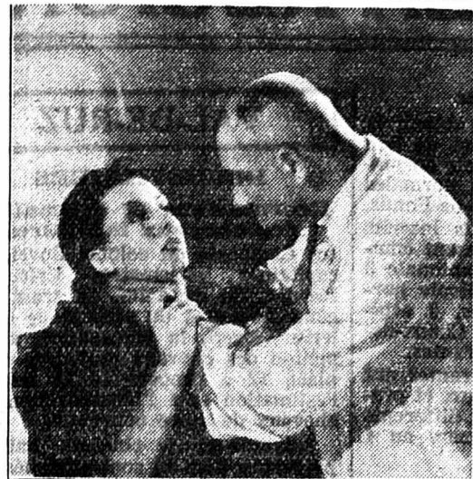
AU PROGRAMME: L'ACTUALITÉ PATHÉ AVEC LES MEILLEURS REPORTAGES Retenez vos places - Téléphone 5 21 12

SAMEDI et JEUDI Matinée à 3 h. PARTERRE Fr. 1.— GALERIE Fr. 1.50