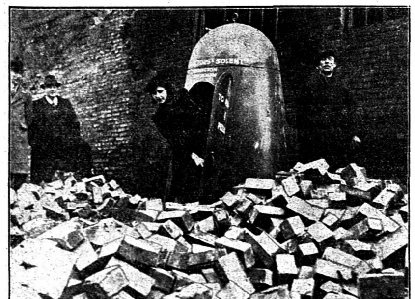
De nouveaux abris contre les bombardements aériens viennent d'être essayés en Angleterre. Le mur d'une usine fut miné et s'écroula sur un abri qui résista parfaitement, ainsi que le montre ce cliché