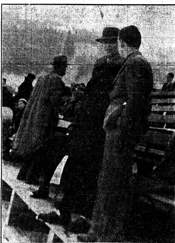
Le prince de Monaco, accompagné de son fils Régnier, est actuellement en séjour à Gstaad. - Les voici tous deux assistant aux épreuves du concours hippique