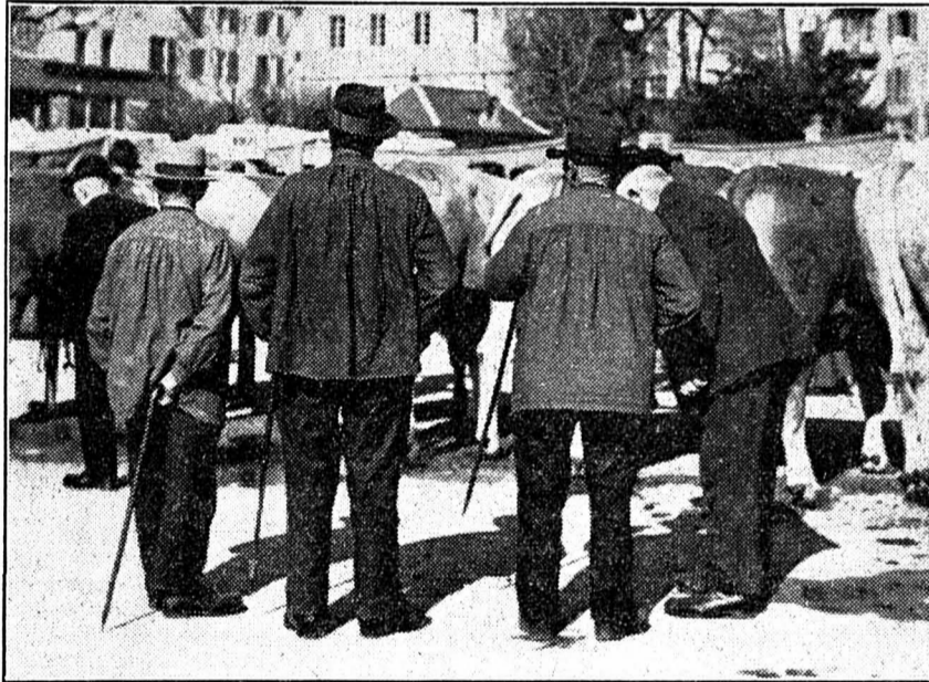
Longuement, consciencieusement, nos paysans examinent chaque bête...