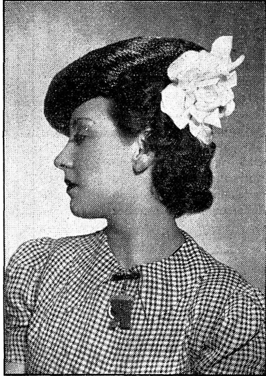
Bourrelet paille brillante noire, garni gardenia blanc.