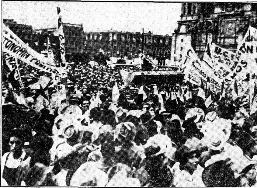
Sur la grande place de Mexico, devant le palais national, les Mexicains manifestent contre les compagnies pétrolières et approuvent la décision du président Cardenas. On remarque un cercueil portant «Huasteca», représentant la compagnie de pétrole de Huasteca.