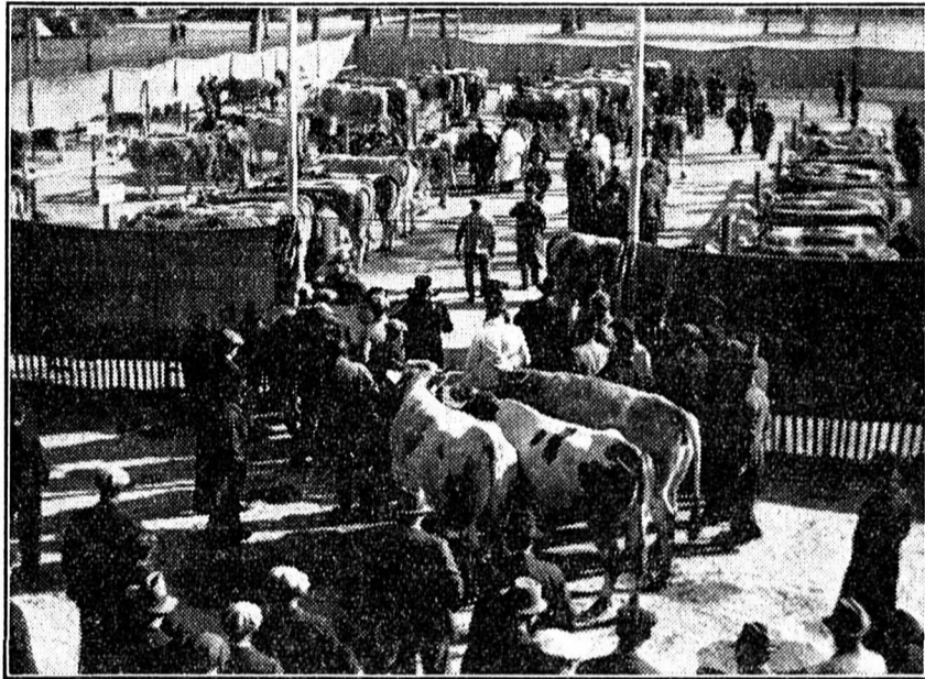
Une vue générale du marché-concours : Quelques pièces de bétail arrivent encore.

En général, les exposants sont repartis satisfaits dans toutes les directions ; aussi, peut-on conclure à la réussite complète du marché qui, à l'avenir, pourrait être encore mieux fréquenté par les agriculteurs.