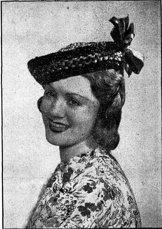
Breton en paillasson noir, garni de ruban de paille vert, jaune et rouge.