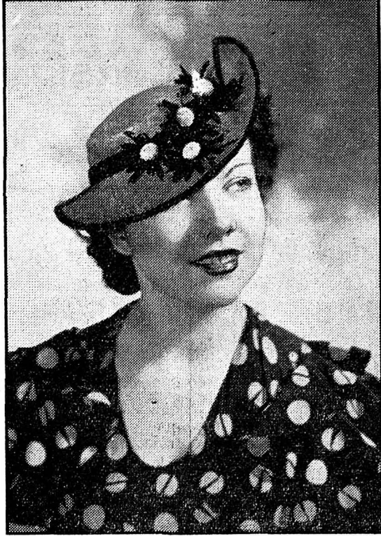
Laize de paille bien relevé sur le côté, garnie fleurs et ruban bleu.