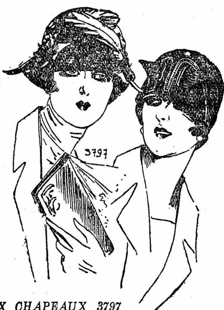
DEUX CHAPEAUX 3797

1. Petite robe de crêpe uni et fantaisie ou crotone unie et fantaisie ; dans le haut, empicement appliqué sur les fronces. 2. Même genre pour le garçonnet ; la petite blouse est moins froncée que celle de la fille.