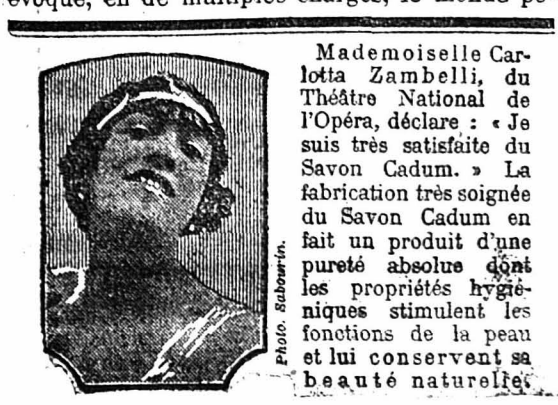
Mademoiselle Carlotta Zambelli, du Théâtre National de l'Opéra, déclare : « Je suis très satisfaite du Savon Cadum. » La fabrication très soignée du Savon Cadum en fait un produit d'une pureté absolue dont les propriétés hygiéniques stimulent les fonctions de la peau et lui conservent sa beauté naturelle.

Les chercheurs et les curieux modernes recueillent comme des trésors d'histoire vécue, les évocations des grands caricaturistes du XIXe siècle. Ce n'est pas seulement un régal d'art qui y trouvent, mais le parfum même des époques évanouies, parfum si jeune et si persistant qu'il donne aux événements une résurrection véritable.