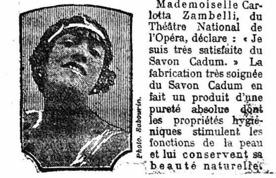
Mademoiselle Carlotta Zambelli, du Théâtre National de l'Opéra, déclare : « Je suis très satisfaite du Savon Cadum. » La fabrication très soignée du Savon Cadum en fait un produit d'une pureté absolue dont les propriétés hygiéniques stimulent les fonctions de la peau et lui conservent sa beauté naturelle.