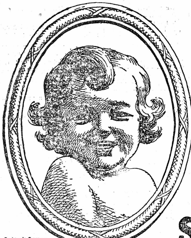
Registre du Commerce (Suisse) n° 8.307.