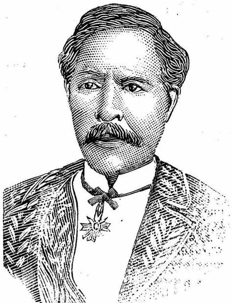
RAINILAIRIVONY PREMIER MINISTRE ET PRINCE-CONSORT Né en 1826; au pouvoir depuis 1864.

Un deuxième boucher de Clichy, un sieur Allais, a été condamné pour le même délit à un an de prison, 50 francs d'amende et cinquante affiches, dont vingt dans le quartier du sieur Allais.