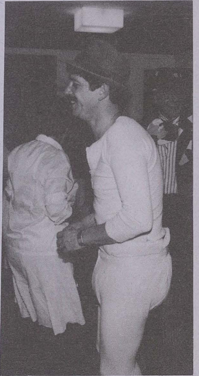
les pampers bout-filtre