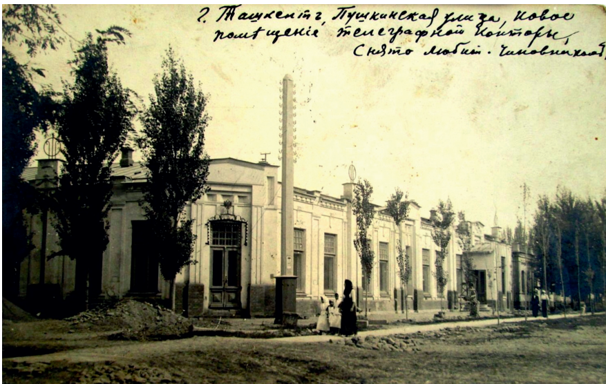
Abbildung 8: Russische Ansichtskarte „Taschkent, Telegrafenamt“.

Eine weitere, ausserordentlich einflussreiche Referenzgruppe rekrutierte sich aus den Vertretern des in Turkestan stationierten russischen Militärs. Führende Fotografen, die Turkestan fotografisch „dokumentierten“, kamen vor allem aus den Reihen des russischen Militärs. Zu der dritten Gruppe, hier gab es personelle Überschneidungen mit der Gruppe des Militärs (Mittelasien als ans Ausland grenzendes Gebiet wurde als General-Gouvernement – d. h. von den Militärs – verwaltet), gehörten russische Beamte (siehe Abbildung 8, auf dem der damalige Absender anmerkte: „Stadt Taschkent, Puschkin-Strasse, Neubau des Telegrafenamtes, aufgenommen durch einen Beamten-Amateurfotografen“). 76