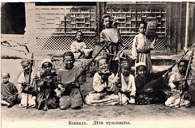
Abbildung 15: Russische Ansichtskarte «Kokand. Deti muzykanty», dt.: „Kokand. Kindermusikanten.“.