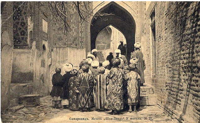
Abbildung 12: Russische Ansichtskarte «Samarkand. Mečet' „Šahi-Zinda“. U mogily. No 27», dt.: Samarkand. Moschee Schahi Sinda. Neben einem 10 Grab. Nr.7.

war, hineinwachsen , während es heutzutage seiner kindspezifischen Kleidung entwächst , selbst wenn diese – in ärmeren Familien – von seinen älteren Geschwistern oder gar von einem Elternteil stammt. Im letzteren Fall handelt es sich in meisten Fällen um eine umgeänderte und an die Morphologie des Kindes angepasste Kleidung. Wie sehr sich die Kindheit als soziale Praxis gewandelt hat, lässt sich am Streit in der Familie erkennen, zu dem es oft wegen der Übergabe der Kleidung von älteren an jüngere Geschwister kommt. Für die damaligen Verhältnisse jedoch trifft voll und ganz auch die folgende Anmerkung von Ariès zu, wie aus der Ansichtskarte „Samarkand. Mečet' „Šahi-Zinda“. U mogily. № 27“ /dt.: Samarkand. Moschee Schahi-Sinda. Neben einem Grab. Nr. 7“ 98 ersichtlich wird (siehe Abbildung 12): „... Hinsichtlich seines Aufzuges unterschied sich das Kind in nichts vom Erwachsenen. Eine gegensätzlichere Haltung in bezug auf die Kindheit lässt sich nicht denken.“ 99 Auf der Ansichtskarte ist ein Ausflug von Kindern dokumentiert, die wie Erwachsene en miniature gekleidet sind und dem heutigen Betrachter wie Zwerge vorkommen.