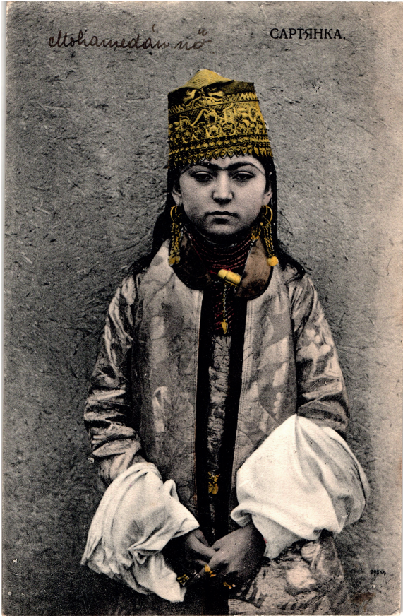
Abbildung 7: Russische Ansichtskarte «Sartjanka», dt: „Sartin“.

und Struktur wie auch den Habitus der Akteure und Institutionen des Feldes der russischen Orientfotografie.