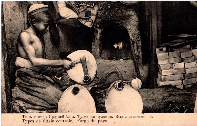
Abbildung 14: Russische Ansichtskarte «Types de l'Asie centrale. Forge du pays».

Das dritte Merkmal (recht frühe Integration von Kindern in die Arbeitswelt) ist ebenfalls oft zu erkennen, z. B. auf der Ansichtskarte „Types de l'Asie centrale. Forge du pays“ (siehe Abbildung 14) oder auf der Ansichtskarte „Kokand. Kindermusikanten“ (siehe Abbildung 15): 104 „ ... Einmal waren die Kinder im alltäglichen Leben mitten unter den Erwachsenen, und an allen alltäglichen Anlässen wie der Arbeit, dem müßigen Umherschlendern oder auch dem Spiel nahmen Kinder und Erwachsene gemeinsam teil ... “ 105