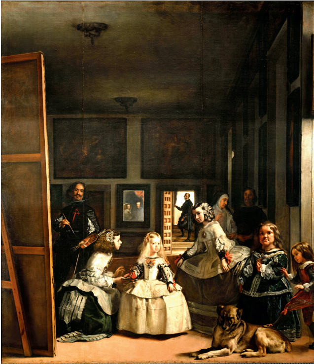
Abbildung 9: „Las Meninas“ („Die Hoffräulein“) von Diego Velázquez (gemalt 1656).

geschilderten Ereignissen auf der Bühne blieb; ähnliche Chorfiguren, die den Blick fangen und auf die zentrale Handlung hinweisen, wurden oft auch von den Malern verwendet ... Ein mittelalterlicher Autor empfiehlt sie sogar in seiner Schrift unter dem Titel Abhandlung über die Malerei : »Ich wünschte, es gäbe da eine Figur, die uns über das Geschehen des Bildes belehrt und unterrichtet ... « 85 Diese Art der Gruppierung ist m. E. ein weiterer Hinweis auf den europäisch geprägten Habitus des Fotografen.