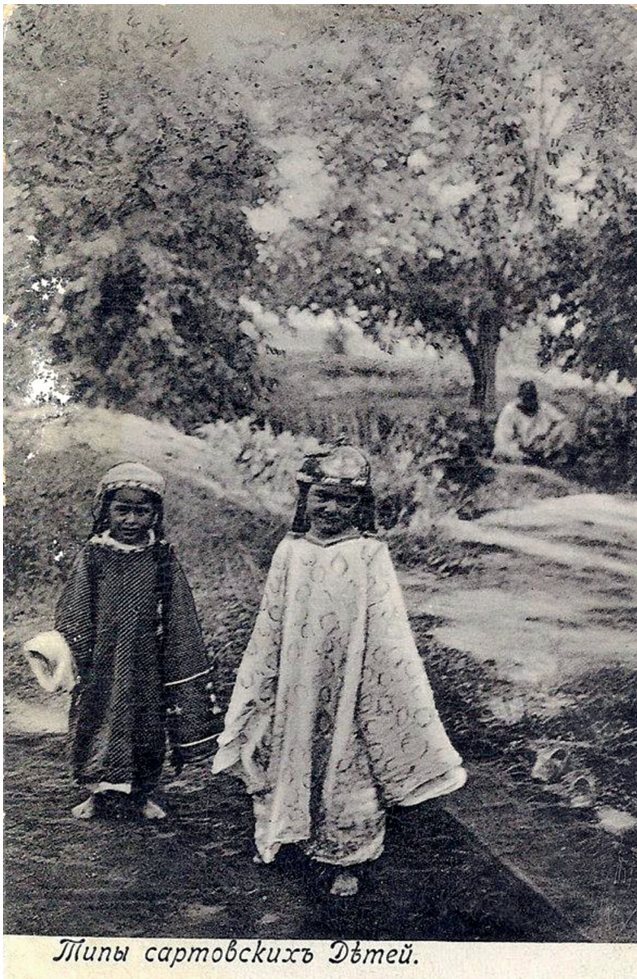
Abbildung 11: Russische Ansichtskarte «Типы sartovskikh Detej», dt.: „Typen von sartischen Kindern“.

Diese Eigenschaft scheinen der Fotograf und sein Verlag erkannt zu haben, denn etwas später brachten sie einen Ausschnitt aus der ursprünglichen Fotografie der Kindergruppe als eine neue Schwarzweiss-Ansichtskarte mit demselben Titel („Typen von sartischen Kindern“) in Umlauf (siehe Abbildung 11). 88