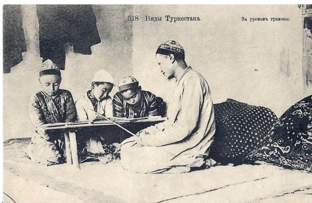
Abbildung 13: Russische Ansichtskarte «518 Vidy Turkestana. Za urokom gramoty», dt.: „518 Ansichten von Turkestan. Während eines Alphabetisierungskurses“.

bekannt ist, 100 wird fälschlicherweise als „Schule“ übersetzt. Sie war jedoch nur dem Namen nach eine Schule; in Wirklichkeit handelte es sich dabei um ein persönliches Lehrverhältnis oder regelmässige Repetitorien. (siehe Abbildung 13 «518 Vidy Turkestana. Za urokom gramoty», dt.: „518 Ansichten von Turkestan. Während eines Alphabetisierungskurses“). 101 Ausserdem fand der Unterricht in vielen Fällen nicht ganzjährig, sondern meistens im Winter oder im frühen Sommer statt. Es gab dort keine Differenzierung nach dem jeweiligen Alter; jüngere Schüler wurden oft nicht nur vom Lehrer, sondern auch von älteren „Semestern“ unterrichtet. Über diese Art von „Schulen“ schrieb Constantin Graf von der Pahlen Folgendes: „Die Jungen wachsen unter den Männern heran. Früh nimmt der Vater den Sohn mit, wenn er ausreitet oder in die Stadt geht. Weit entfernt von ihrem Haus begegnet man unterwegs oft solchen Jungen, die mit dem Vater auf einem Pferd reiten. Vom sechsten Lebensjahr an beginnt für den Sohn die Zeit, in der jeder Familieneinfluß aufhört. Das ist der Eintritt in die Schule, die Mechtebe oder tatarisch Maktaba ...“ 102 „... Wenn der kleine Junge in die Mechtebe eintritt, findet er andere Jungen vor, die schon mehrere Jahre dort sitzen und immer dasselbe auswendig gelernt haben und immer wieder lernen und lesen müssen: das heilige Gesetz des Propheten, den Shariat ...“ 103