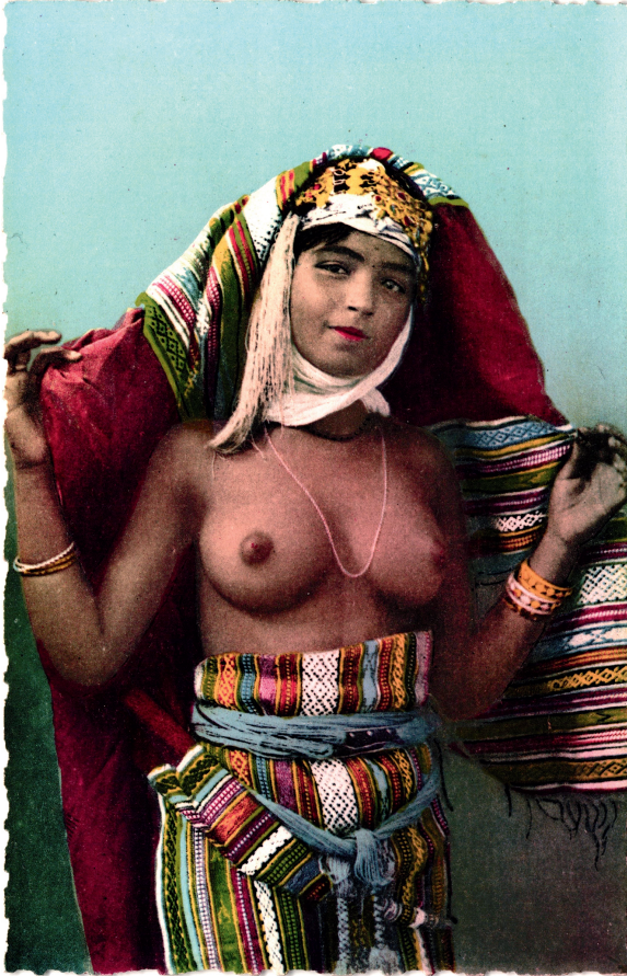
Abbildung 6: Französische Ansichtskarte «Beauté mauresque».

aber auch Kamele, das unvermeidliche Symbol des Orients, oder träge Esel als Zeichen der Rückständigkeit. Die gängigen Stereotypen beeinflussten die kommerziellen Orientaufnahmen.“ 66