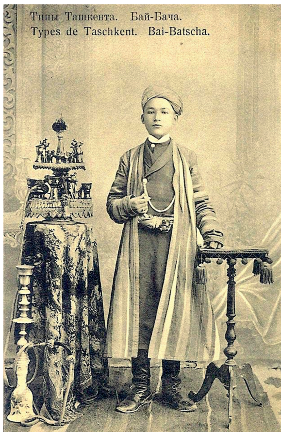
Abbildung 4: Russische Ansichtskarte «Types de Taschkent. Bai-Batscha».

hier aufgeführte Ansichtskarte („Types de Taschkent. Bai-Batscha“) deutlich veranschaulicht (siehe Abbildung 4). 48