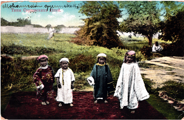
Abbildung 3: Russische Ansichtskarte «Typy Sartovskikh detej», dt.: „Typen von sartischen Kindern“.

Im Folgenden sollen die Grundlagen der besagten „seltsamen Übung“ Bourdieus kurz zusammengefasst und dann auf die russische Ansichtskarte („Typy Sartovskikh detej“, dt.: „Typen von sartischen Kindern“, siehe Abbildung 3) 37 angewandt werden.