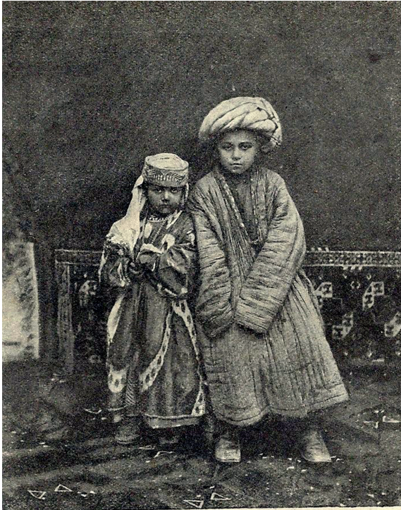
Рис. 197 Дети-бухарцы.

Abbildung 10: «Deti-bukharcy», dt.: „Kinder aus Buchara“.