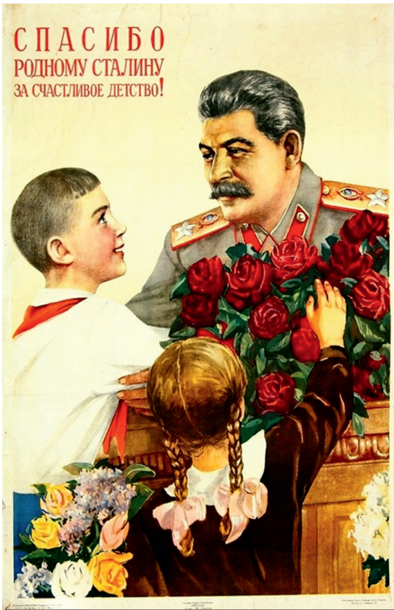
Abbildung 1: Sowjetische Bildpostkarte aus dem Jahre 1939.

„Wir bedanken uns beim Genossen Stalin für unsere glückliche Kindheit!“ 2 (siehe Abbildung 1) 3 war eine der vielen ideologischen Losungen auf den Transparenten, die in der gesamten Sowjetunion gewöhnlich während der Demonstrationen getragen und an den Häuserfassaden angebracht wurden. Eben jene Parole tauchte wiederum als Refrain in zahlreichen Artikeln der sowjetischen Presse und diversen Fachpublikationen der Zeit auf, welche sich