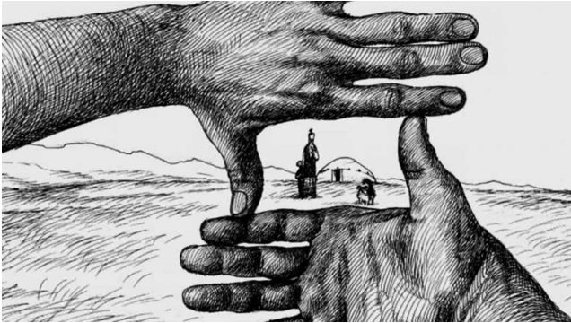
Abbildung 5: Manuelle Suche nach einem passenden Sujet.

Einem Gemälde gleich kommt die Ansichtskarte erst durch den Rahmen zustande, denn „die im Rahmen eingeschlossene Welt wird auf diese Weise zu einer sich selbst genügenden, autarken Welt ...“ 53 Zugänge zu dieser historischen Welt en miniature werden dann durch die praxeologische Analyse der historischen Ansichtskarte geschaffen.