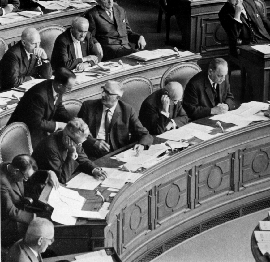
Im Ständerat (1959–1967)

der Arbeitslosigkeit die Mitgliederbeiträge nicht mehr bezahlen konnten oder wollten. Die gewerkschaftlichen Arbeitslosenkassen, die keine Bundes- und Kantonssubventionen bekamen und somit einzig auf die Eigenfinanzierung durch die Mitglieder angewiesen waren, brachen ebenfalls zusammen. Diese erste Krisenzeit begann 1922 und dauerte fast ununterbrochen bis 1938. So begann für viele Oberwalliser das «Reislaufen» nach Arbeitsplätzen, so auch in die Aufbaugebiete der kriegsverwüsteten Länder, hauptsächlich nach Nordfrankreich und auch etwa nach Deutschland. Viele davon fanden dort ihre bleibende Stätte und kehrten nicht wieder in die Heimat zurück.