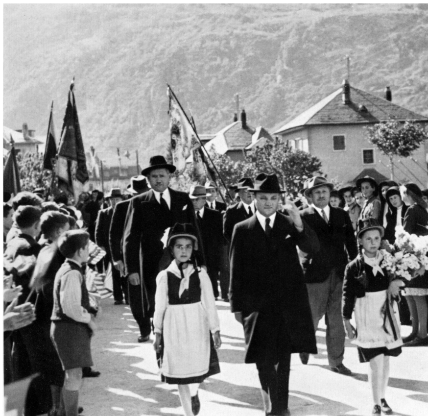
Empfang als Präsident des Grossen Rates in Brig am 10. Mai 1943. Im Hintergrund Staatsrat Karl Anthamatten (1897–1957), Staatsrat Cyrille Pitteloud (1889–1971)

sturz). 1917 und 1918 herrschte in der ganzen Schweiz eine verheerende Grippe mit vielen tödlichen Folgen. Sie brach vorerst im Militär aus und griff dann auf die Zivilbevölkerung über.