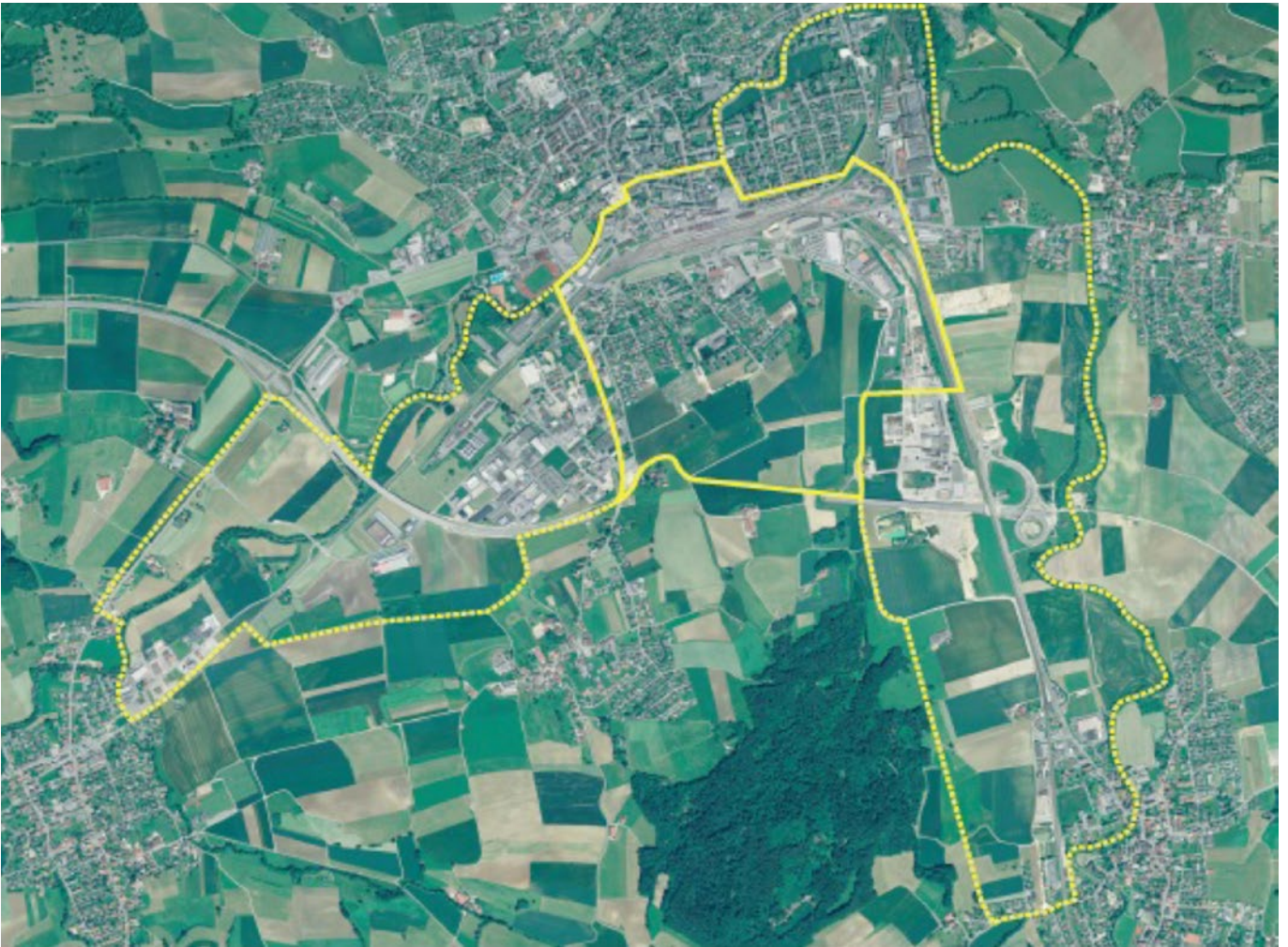
Le « territoire de confluence » est défini par l'ensemble des surfaces destinées à couvrir les besoins du développement de l'agglomération avec une dimension régionale et cantonale.

Une première étape (phase 1) a été réalisée en 2013. Le rapport technique adopté par le conseil d'agglomération le 1 er octobre 2013 précise la problématique, les enjeux et les objectifs de la démarche.