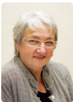
Par Françoise Collarin

Présidente de la Commission d'aménagement