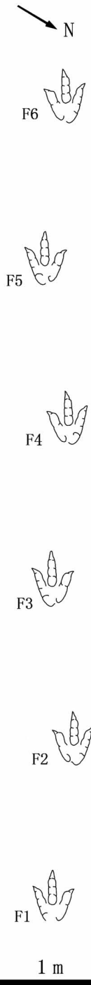
图 1 自贡威远足迹(新属、新种)正型标本 ZDM 0032(F1-F6, 1,3,5 为左,2,4,6 为右) Fig. 1 Weiyuanpus zigongensis ichnogen. et ichnosp. nov., holotype, ZDM 0032 (F1-F6, 1, 3, 5. left footprints; 2, 4, 6. right footprints)

威远标本(ZDM 0032)个体较大,宽长比约 72%。两足行走,三趾型,爪痕明显,无拇趾及尾迹。可将其归入兽脚类恐龙足迹中实