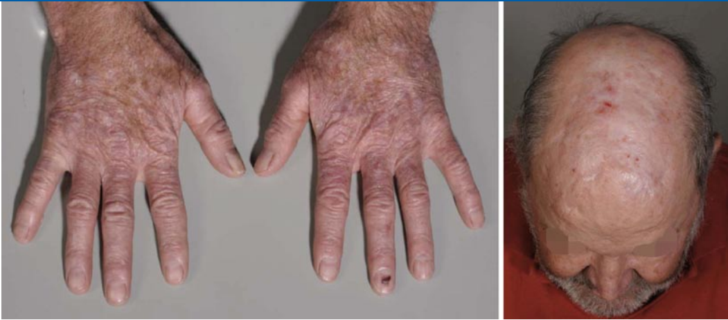
Abb. 1 ◀ Eine ausgedehnte Feldkanzerisierung der Haut, wie hier im Bereich der sonnenexponierten Handrücken und Finger Rücken oder des androgenetischen Areals des Capillitiums zu sehen, sollte bei einem organtransplantierten Patienten Anlass dazu sein, die immunsuppressive Medikation in ihrer Höhe und Zusammensetzung mit dem behandelnden Transplantationsmediziner zu besprechen

krebs nach Organtransplantation wird in einem anderen Beitrag dieses Themenhefts ausführlich besprochen. Generell erhöht eine ausgeprägte Immunsuppression das Risiko für Hautkrebs [5]. Bisher unklar ist jedoch, welche Medikamentendosis oder Kombination von Immunsuppressiva die wichtigste Rolle bei der Hautkrebsentstehung spielt.