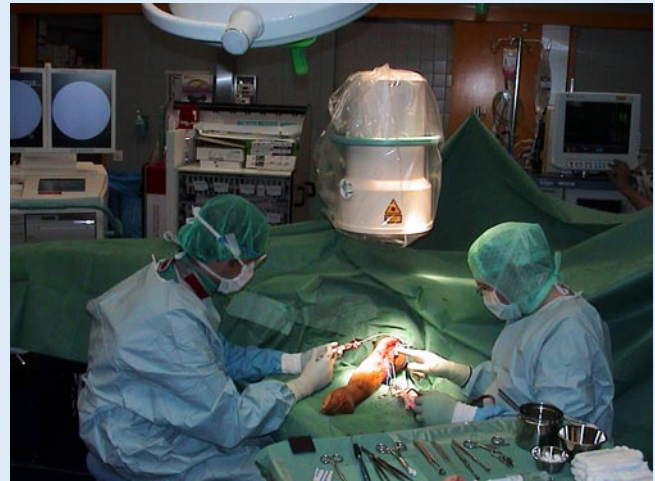
Abb. 2 ▲ Einrichtung des Operationssaales mit Röntgenanlage und Materialwagen, die standardisierte Sets für kathetertechnische Interventionen enthalten. Im Bild: Revision einer verschlossenen Oberarmfistel (V.-cephalica-Fistel) mit zentraler Stenose der V. subclavia